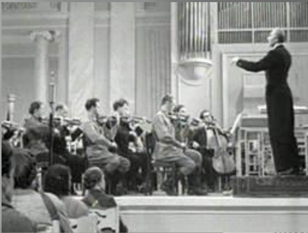
Репетиция «Ленинградской» симфонии