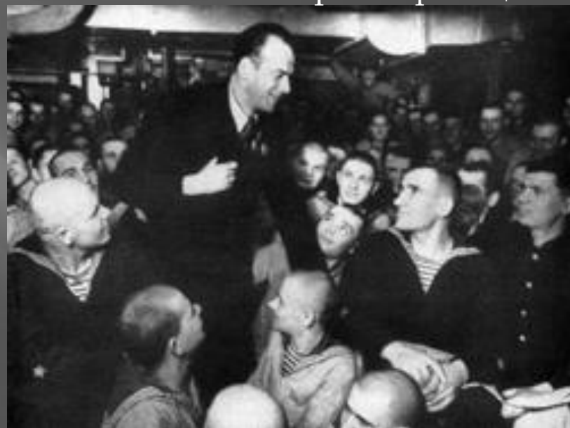
Театральный Агитвзвод Дома Красной армии на фронте.