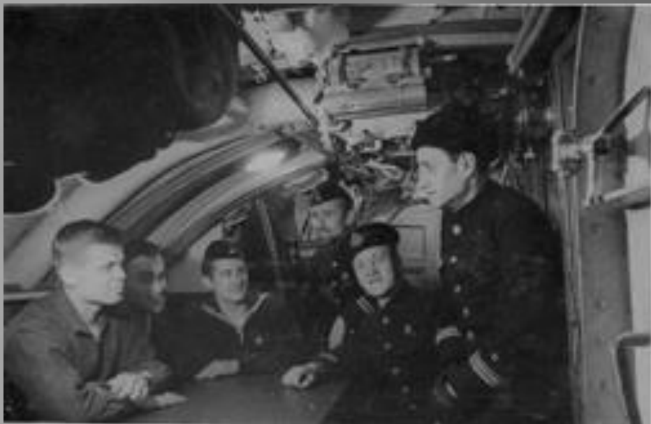
Композитор К. Я. Листов (справа) на подводной лодке «Щ-406».