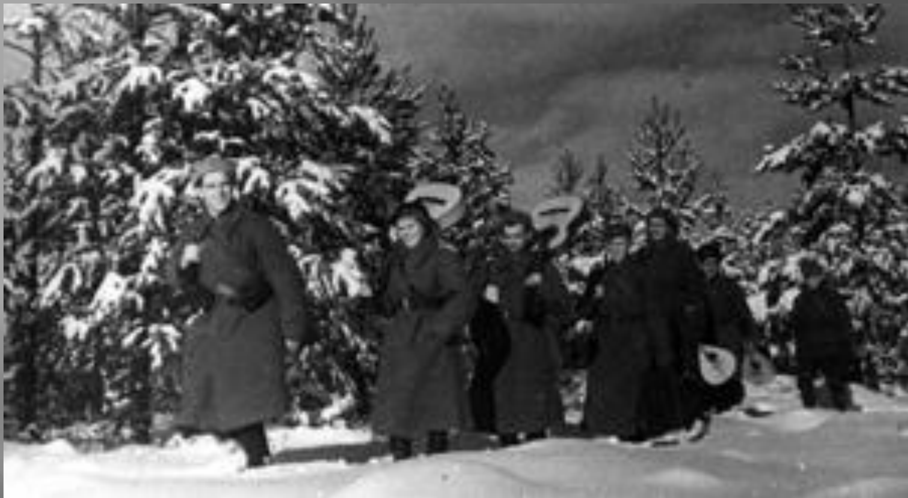
Участники фронтового ансамбля на пути к зрителям.