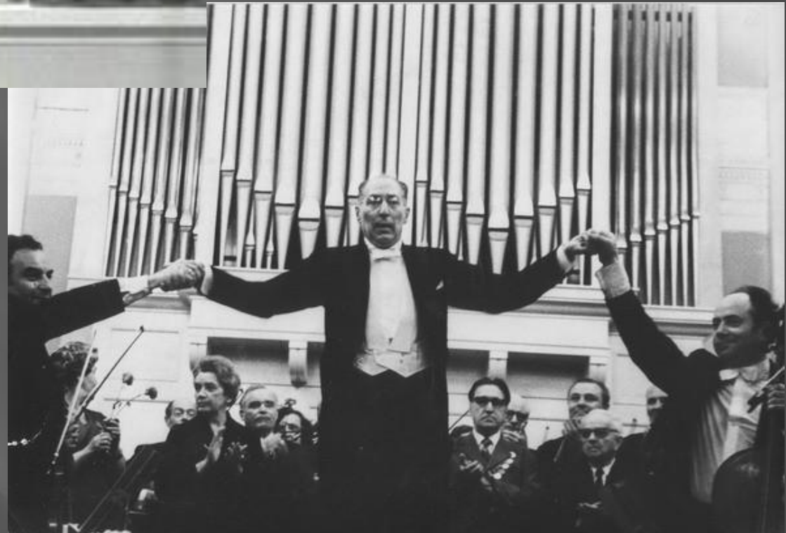
К. И. Элиасберг