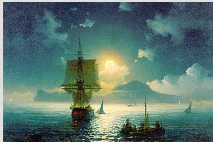
И.К. Айвазовский. Лунная ночь на Капри