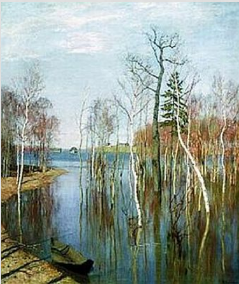
И.И.Левитан «Весна. Большая вода»

Пример холодного, спокойного, сдержанного колорита.