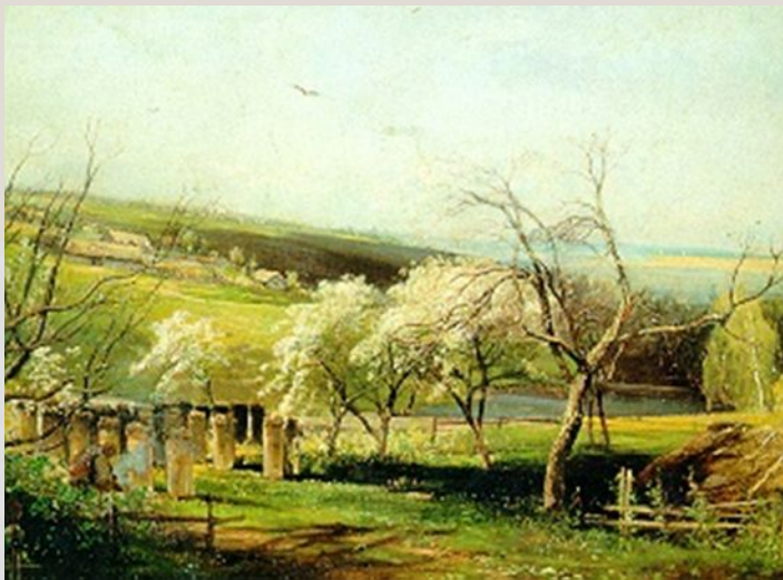
А.К. Саврасов. Сельский вид

МНОГООБРАЗИЕ И СОГЛАСОВАННОСТЬ ЦВЕТОВЫХ ТОНОВ С ГРАДАЦИЯМИ СВЕТОТЕНИ, ПЕРЕДАЮЩИЕ ХАРАКТЕРНЫЕ МАТЕРИАЛЬНЫЕ СВОЙСТВА ИЗУЧАЕМОЙ НАТУРЫ, ЯВЛЯЕТСЯ ГЛАВНОЙ ОСОБЕННОСТЬЮ КОЛОРИТА