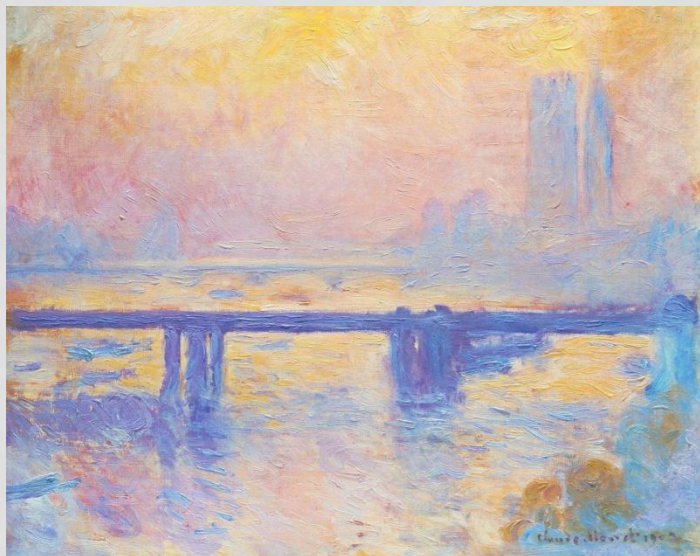
Клод Моне мост Чаринг-кросс

МНОГООБРАЗИЕ И СОГЛАСОВАННОСТЬ ЦВЕТОВЫХ ТОНОВ С ГРАДАЦИЯМИ СВЕТОТЕНИ, ПЕРЕДАЮЩИЕ ХАРАКТЕРНЫЕ МАТЕРИАЛЬНЫЕ СВОЙСТВА ИЗУЧАЕМОЙ НАТУРЫ, ЯВЛЯЕТСЯ ГЛАВНОЙ ОСОБЕННОСТЬЮ КОЛОРИТА