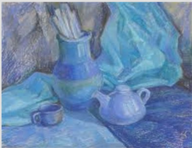
Холодная гамма цветов

В практике реалистической живописи этот термин используется в других, более узких значениях, близких к понятиям «цветовая гамма», «доминирующий цветовой оттенок», «тональность»