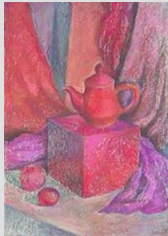
Теплая гамма цветов

В практике реалистической живописи этот термин используется в других, более узких значениях, близких к понятиям «цветовая гамма», «доминирующий цветовой оттенок», «тональность»