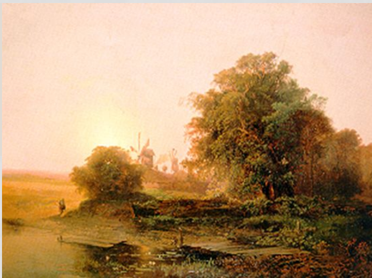
А.К. Саврасов. Летний пейзаж с мельницами.

ЛАТИНСКОГО COLOR — ЦВЕТ, КРАСКА) — ГАРМОНИЧНОЕ СОЧЕТАНИЕ, ВЗАИМОСВЯЗЬ, ТОНАЛЬНОЕ ОБЪЕДИНЕНИЕ РАЗЛИЧНЫХ КАРТИНЕ.