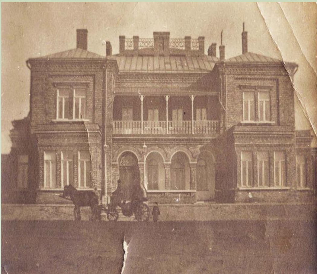
Дом Юза 1900 год