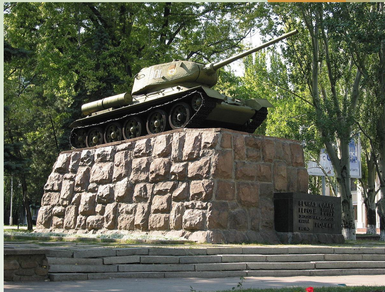
Современный вид памятника