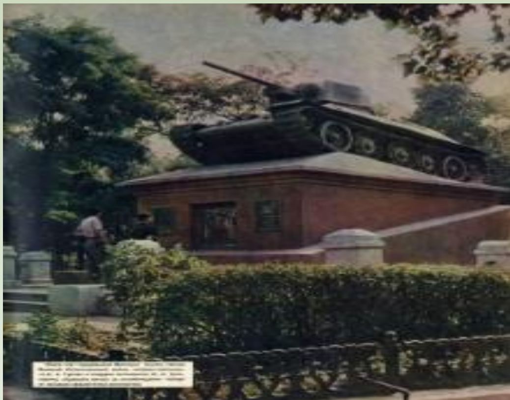
Первоначальный вид памятника 1960 г.