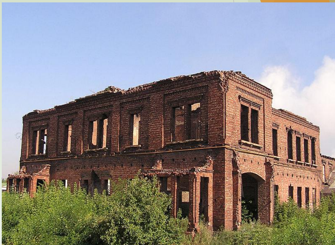
Современный вид дома 2006 г.