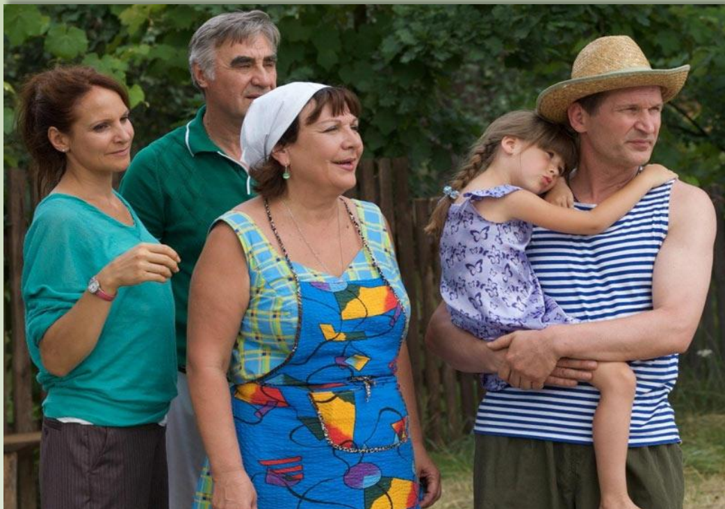
Кадры из популярного сериала «Сваты»