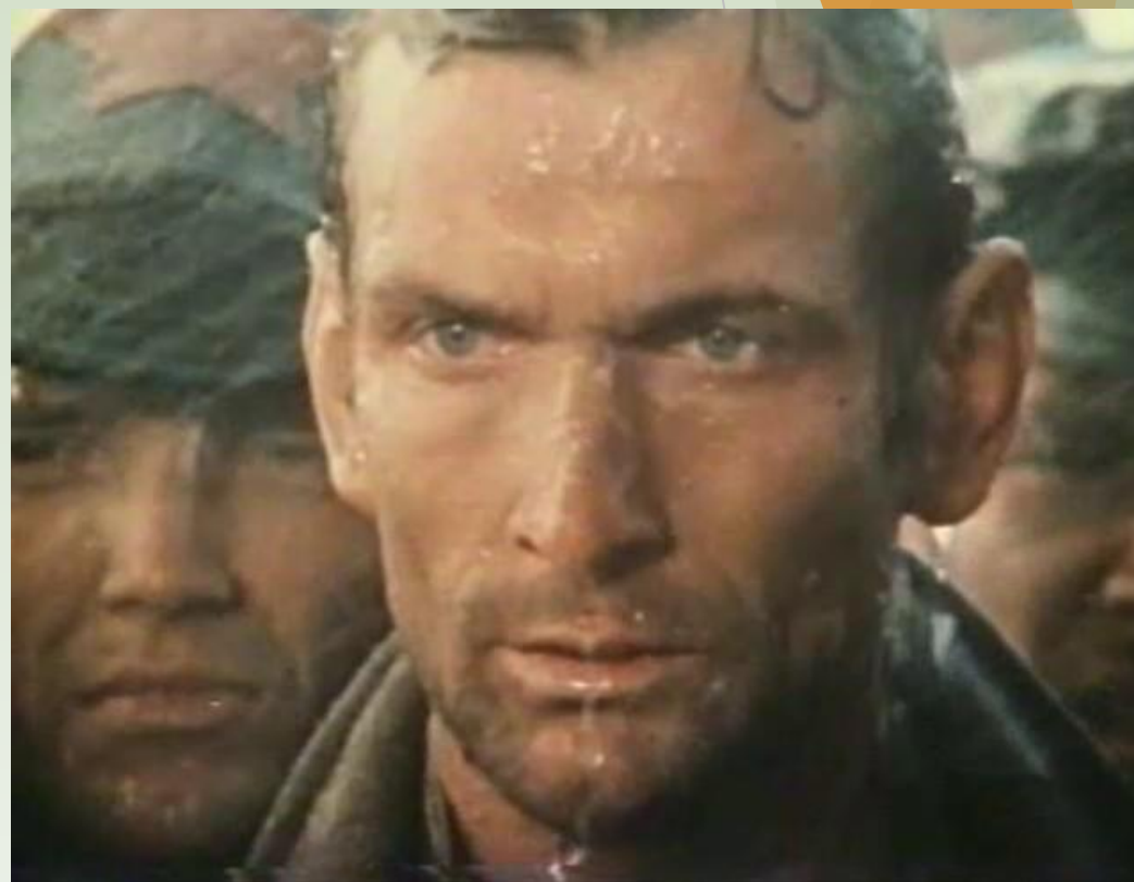
Кадр из фильма «В бой идут одни старики»