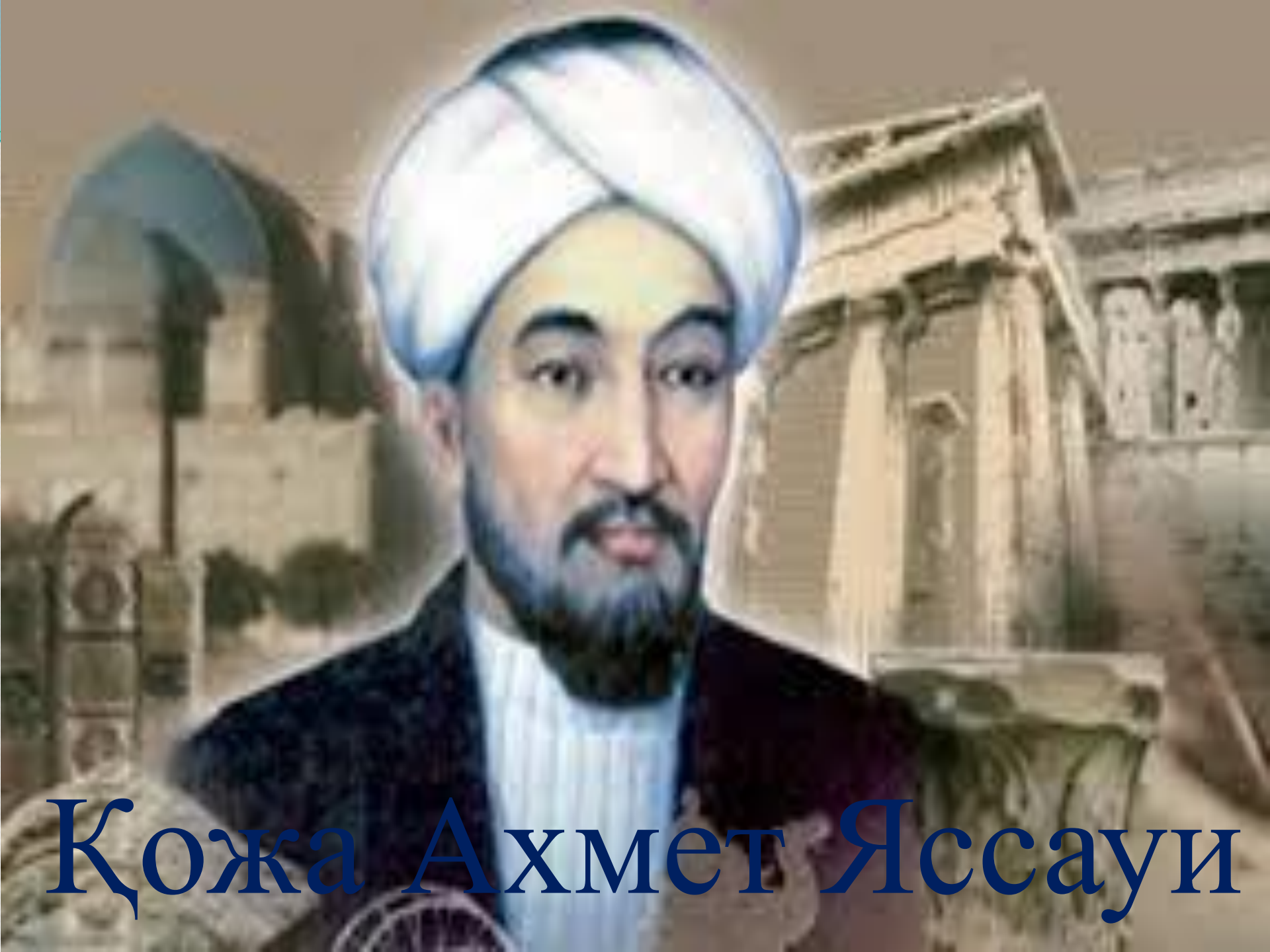
Қожа Ахмет Яссауи