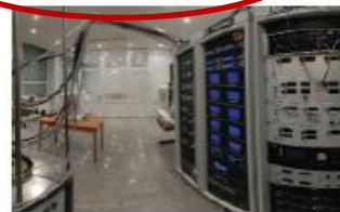
Аспирантура и докторантура

Зарегистрироваться и ввести персональный код