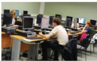
Среднее профессиональное образование