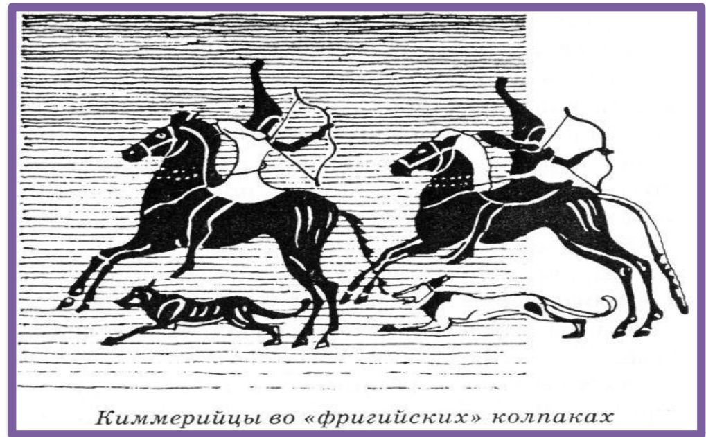
Киммерийцы во «фригийских» колпаках