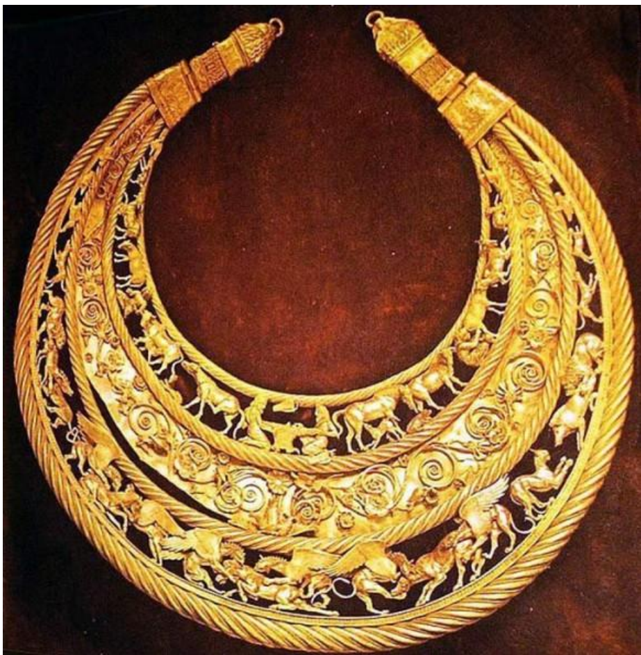
Царская золотая пектораль