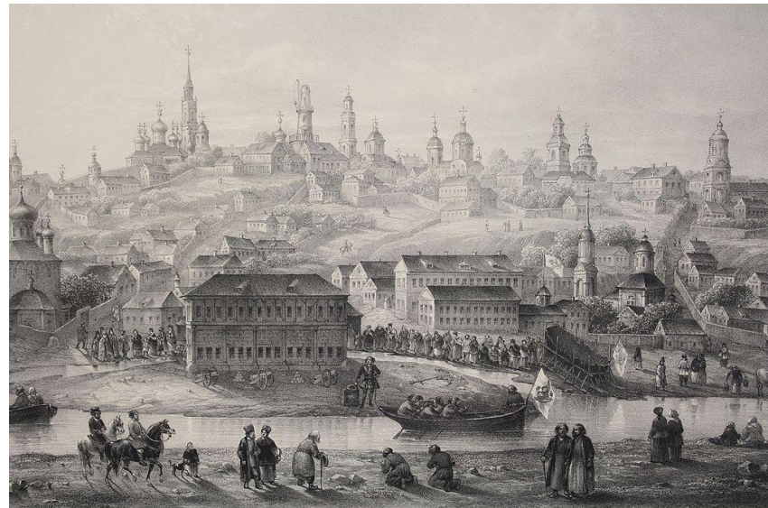
Гравюра Воронежа, XVIII век