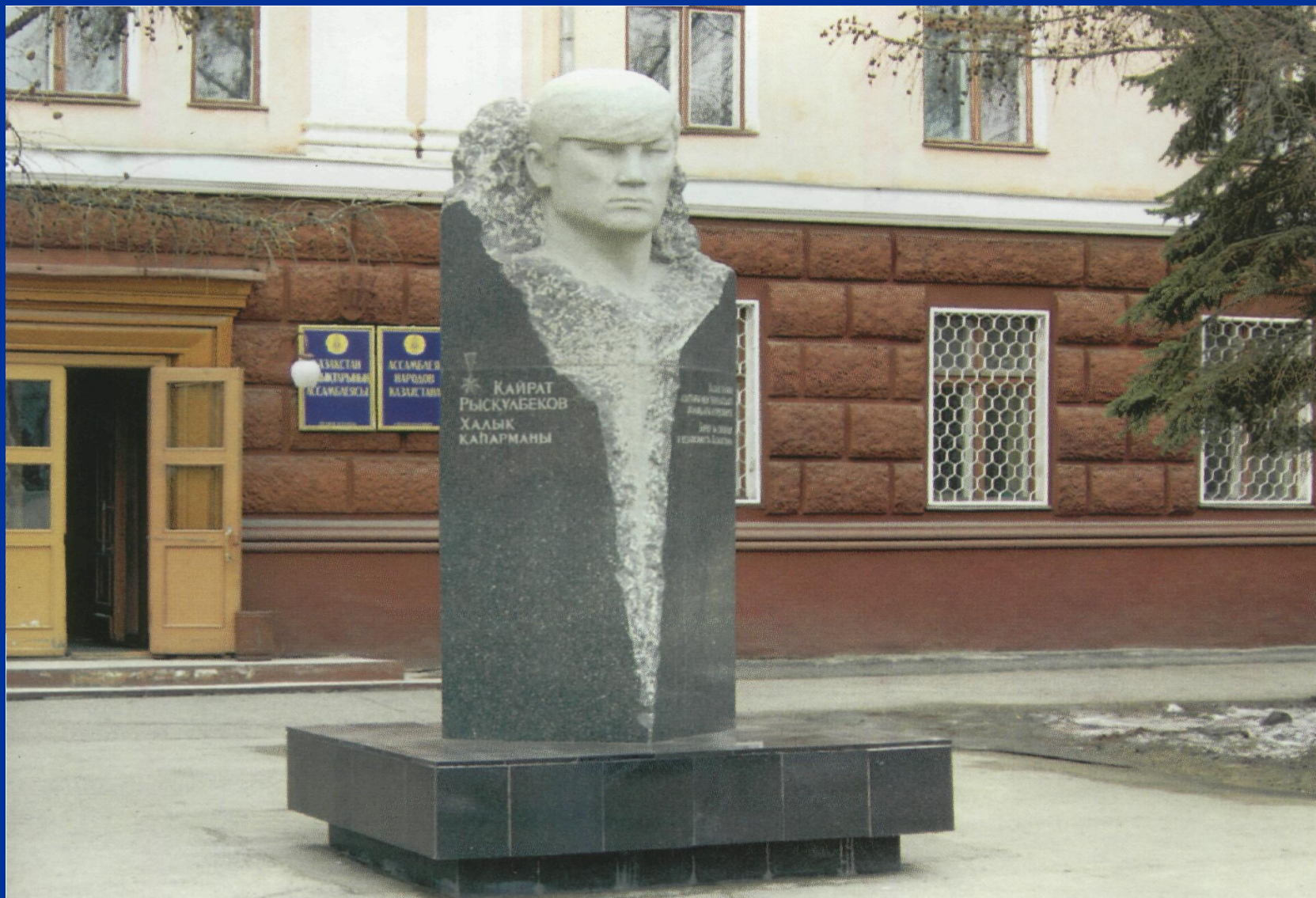
Халық қаһарманы Қайрат Рысқұлбековке орнатылған ескерткіш. Семей қаласы