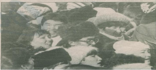
Алматы. 1986. Желтоқсан.