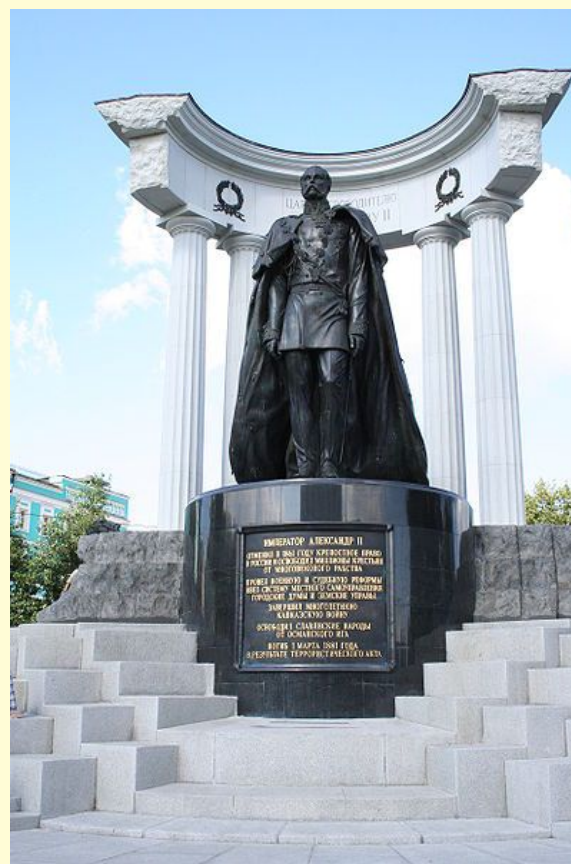
Памятник Александру II