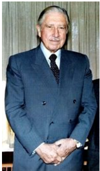
Аугусто Пиночет Чили (1973 – 1990)