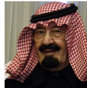
Абдуллах ибн Абдул-Азиз Король Саудовской Аравии с 2005