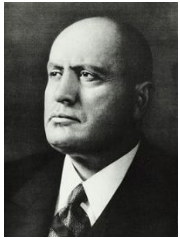
Бенито Муссолини Италия (1922 – 1943)