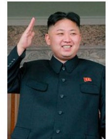
Ким Чен Ын (с 2011)