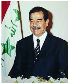
Саддам Хусейн Ирак (1979 -2003)