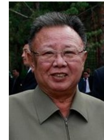
Ким Чен Ир (1994 – 2011)