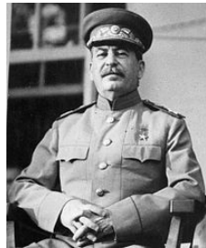
Иосиф Виссарионович Сталин СССР (1924 – 1953)