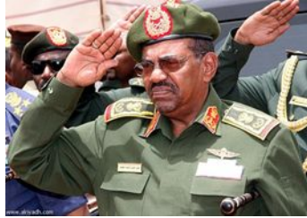
Омар аль-Башир Судан (с 1989)