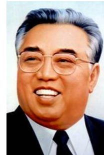
Ким Ир Сен Северная Корея (до 1994)