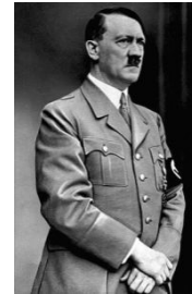
Адольф Гитлер Германия (1933 – 1945)