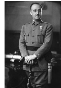
Франсиско Франко Испания (1939 – 1975)