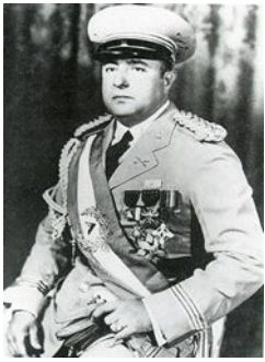
Анастасио Сомоса Никарагуа (1974 – 1979)