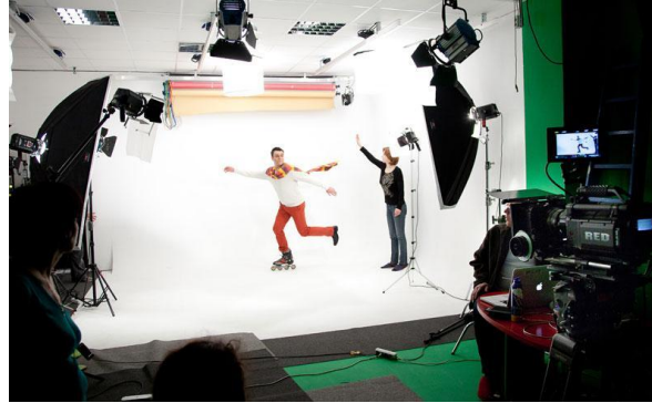
Рекламные и продающие ролики