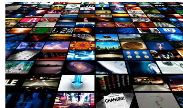
Стокове видео. Видеохостинги.