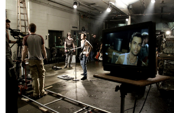
Клипы, Live, кавера, танцевальные видео