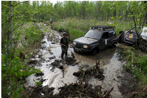
Отчетные и промо ролики