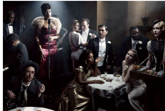
Игровое, документальное, короткометражное кино