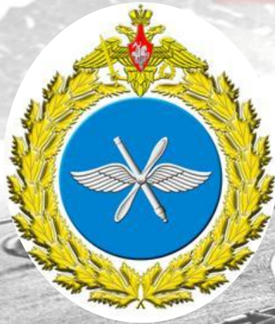
Большая эмблема ВВС РФ

Вид Вооруженных Сил, предназначенный для защиты органов высшего государственного и военного управления, стратегических ядерных сил, группировок войск, важных административно-промышленных центров и районов страны от разведки ударов с воздуха, для повышения мобильности, ведения комплексной разведки и выполнения специальных задач