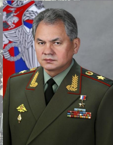
Министр обороны РФ, генерал армии С.К. Шойгу