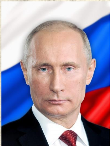
Президент РФ, Верховный главнокомандующий ВС РФ В.В.Путин