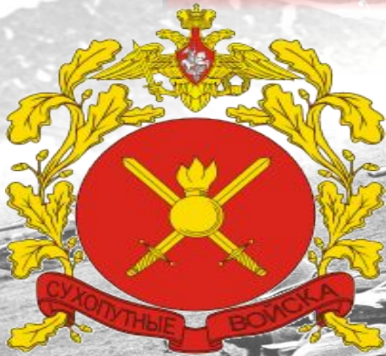
Большая эмблема сухопутных войск РФ

Вид Вооруженных Сил Российской Федерации, предназначенный для прикрытия Государственной границы, отражения ударов агрессора, удержания занимаемой территории, разгрома группировок войск и овладения территорией противника