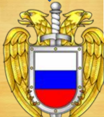
Федеральная служба охраны