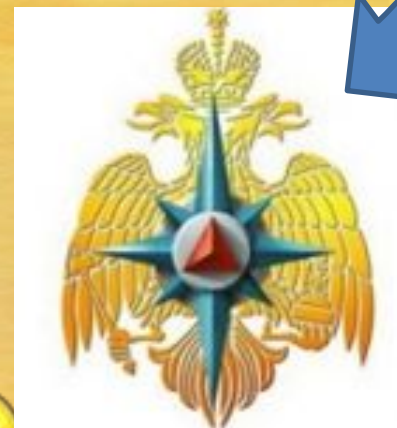
Войска ГО МЧС России