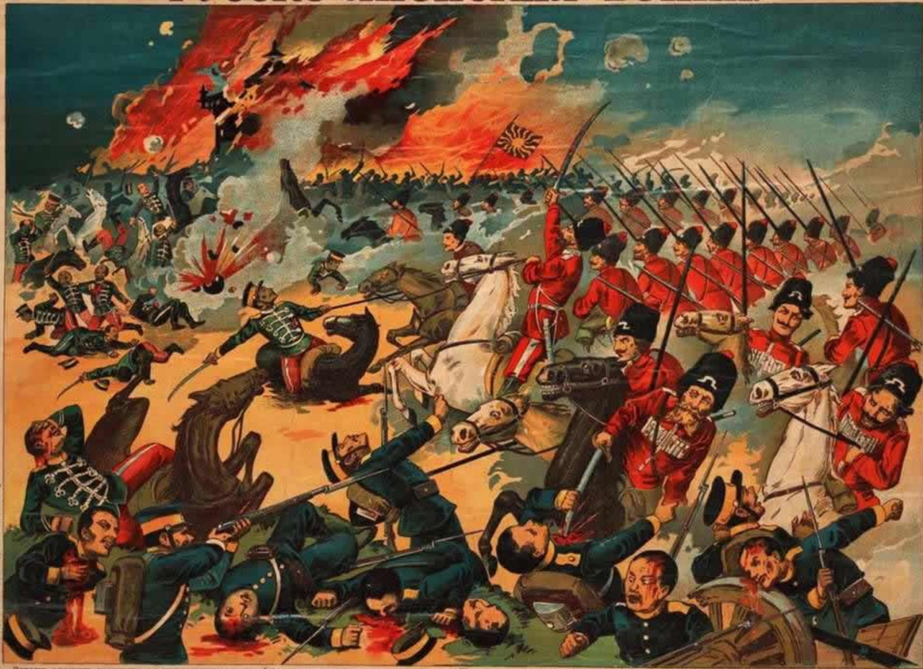
Захват русских шашечных отрядов транспортной обозы, предназначенного для японских войск, направлявшегося к р. Нань-Кангале. Достиглось из добычи его лошадей, большое количество огнестрельного оружия и припасов (Тор. архив.)

№ 8 Издание Типо-Литографии "РУССКАГО ТОВАРИЩЕСТВА Печать и Издатель. Дьла". Москва. Миллионная переулок, собственный домъ.