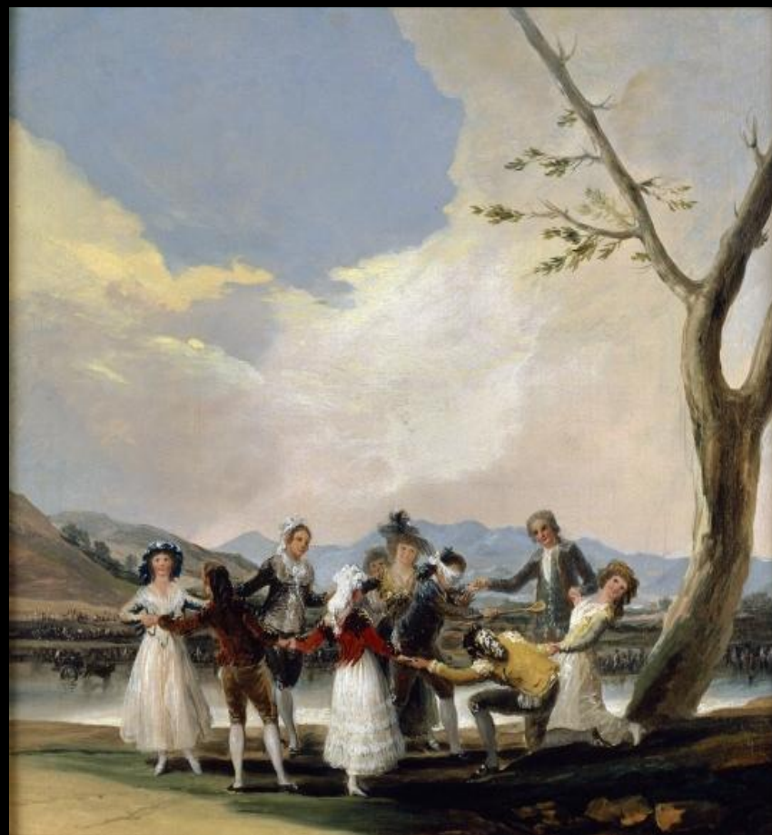
Игра в жмурки