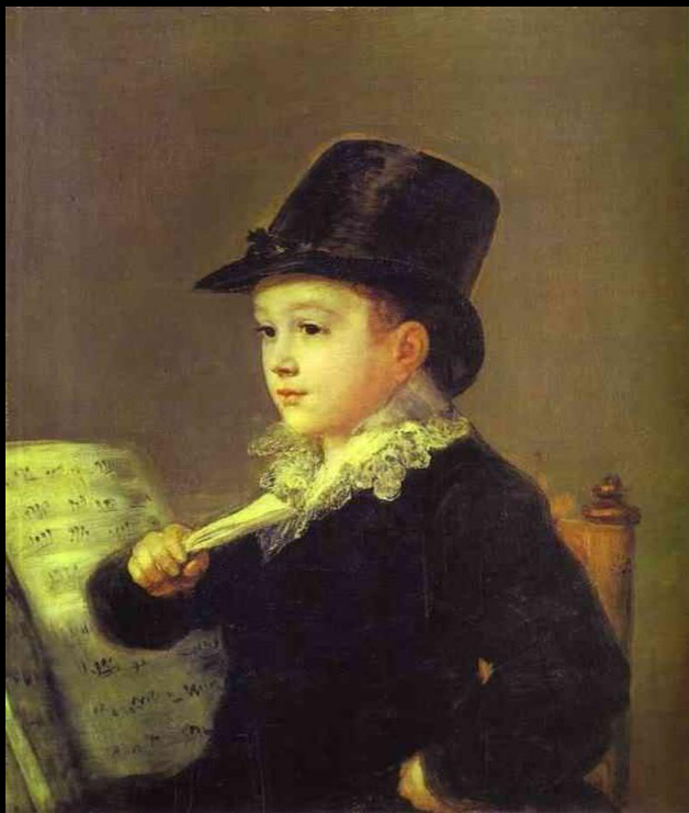
Портрет внука Мариано Гойя