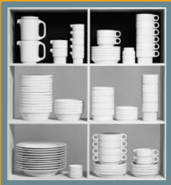
Ульмский табурет, 1954 г

УЛЬМСКАЯ ШКОЛА ДИЗАЙНА (НЕМ. HOCHSCHULE FÜR GESTALTUNG ULM) - УЧЕБНОЕ ЗАВЕДЕНИЕ В НЕМЕЦКОМ ГОРОДЕ УЛЬМ, ГОТОВИВШЕЕ СПЕЦИАЛИСТОВ В ОБЛАСТИ ДИЗАЙНА. БЫЛА ОСНОВАНА В 1949 Г., А В 1953- М СОСТОЯЛОСЬ ЕЕ ОФИЦИАЛЬНОЕ ОТКРЫТИЕ. ЕЕ ПЕРВЫМ РЕКТОРОМ СТАЛ ХУДОЖНИК, АРХИТЕКТОР И СКУЛЬПТОР МАКС БИЛЛ , В ПРОШЛОМ ВЫПУСКНИК «БАУХАУЗА». ШКОЛА ПРОВОЗГЛАШАЛА ПРИНЦИПЫ БАУХАУСА. НОВЫМ СТАЛО ПРИВЛЕЧЕНИЕ К ПРЕПОДАВАНИЮ ПРАКТИКУЮЩИХ ДИЗАЙНЕРОВ СО СВОЕЙ ТЕМАТИКОЙ И СВОИМИ ЗАДАНИЯМИ, В ЧАСТНОСТИ ДИТЕРА РАМСА. ДЕВИЗ ШКОЛЫ - «ОТ ЛОЖКИ ДО ГОРОДА».