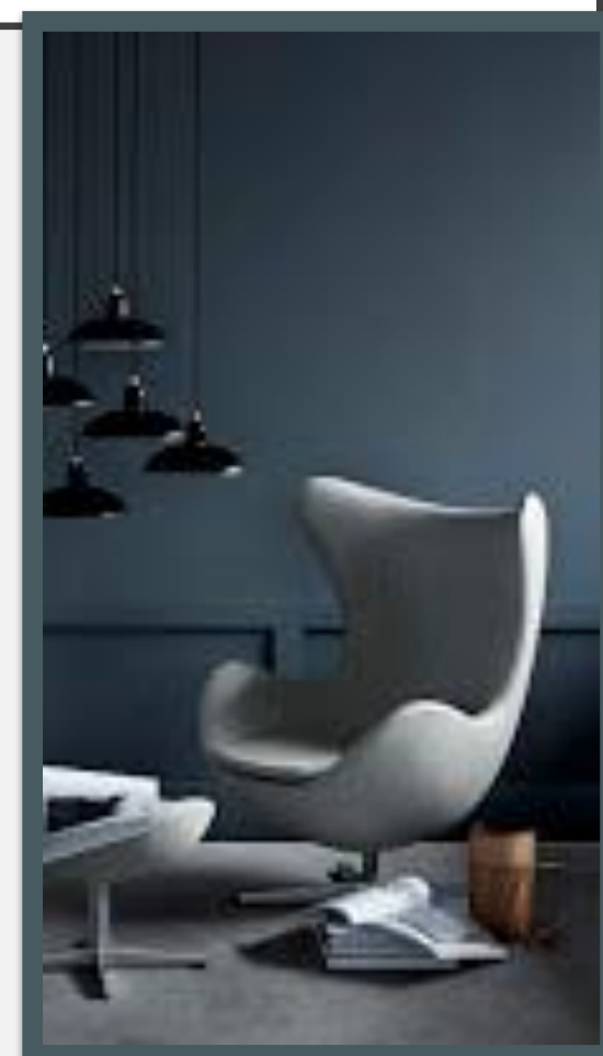
Egg chair, 1958