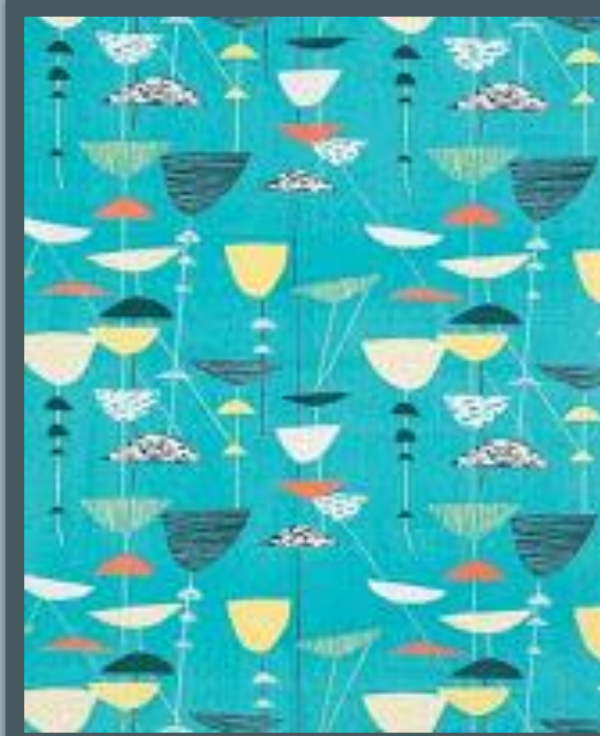
Текстиль от Люсьен Дей

ДИЗАЙН В АНГЛИИ ПРОМЫШЛЕННЫЙ ДИЗАЙНЕР РОБИН ДЕЙ (1915–2010) И ЕГО ЖЕНА ДИЗАЙНЕР ТКАНЕЙ ЛЮСЬЕН (1917–2010) (АНГЛ. ROBIN & LUCIENNE DAY) ПОСЛЕ ВТОРОЙ МИРОВОЙ ВОЙНЫ СДЕЛАЛИ БРИТАНСКИЙ ДИЗАЙН ВЕДУЩИМ И ОПРЕДЕЛЯЮЩИМ ТЕНДЕНЦИИ ПРОЕКТИРОВАНИЯ ВО ВСЁМ МИРЕ. ОНИ ЭКСПЕРИМЕНТИРОВАЛ И С НОВЫМИ МАТЕРИАЛАМИ (ПЛАСТИК, СТАЛЬ И ФОРМОВАННАЯ ФАНЕРА) И СОЗДАВАЛИ НОВЫЕ ФОРМЫ МЕБЕЛИ И ТЕКСТИЛЯ.