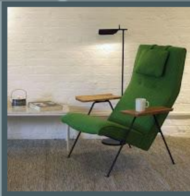
Мебель от Робина Дей