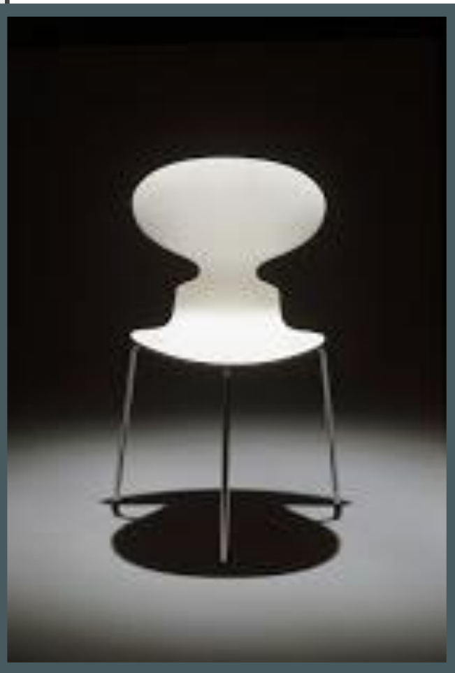
Ant chair, 1952

ДИЗАЙН В СКАНДИНАВИИ (ШВЕЦИЯ, НОРВЕГИЯ, ДАНИЯ, ФИНЛЯНДИЯ) АРНЕ ЭМИЛЬ ЯКОБСЕН (АНГЛ. ARNE EMIL JACOBSEN) 1902 - 1971) - ДАТСКИЙ АРХИТЕКТОР И ДИЗАЙНЕР, ОСНОВОПОЛОЖНИК СТИЛЯ «ДАТСКИЙ ФУНКЦИОНАЛИЗМ». ВМЕСТЕ С АЛВАРОМ ААЛТО ЯВЛЯЕТСЯ НАИБОЛЕЕ ИЗВЕСТНЫМ ПРЕДСТАВИТЕЛЕМ СКАНДИНАВСКОГО ДИЗАЙНА.