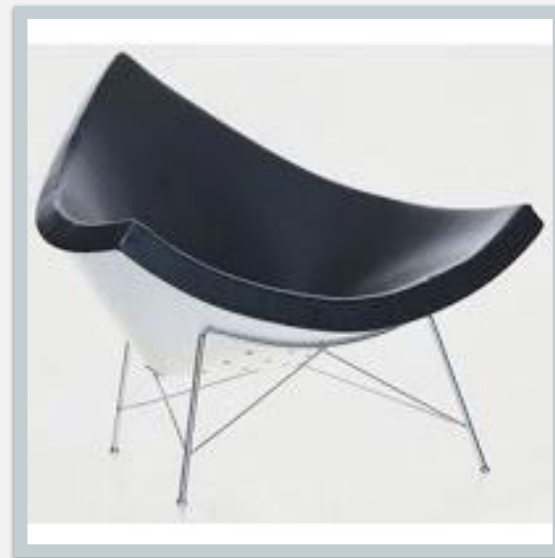
Coconut Chair 1955