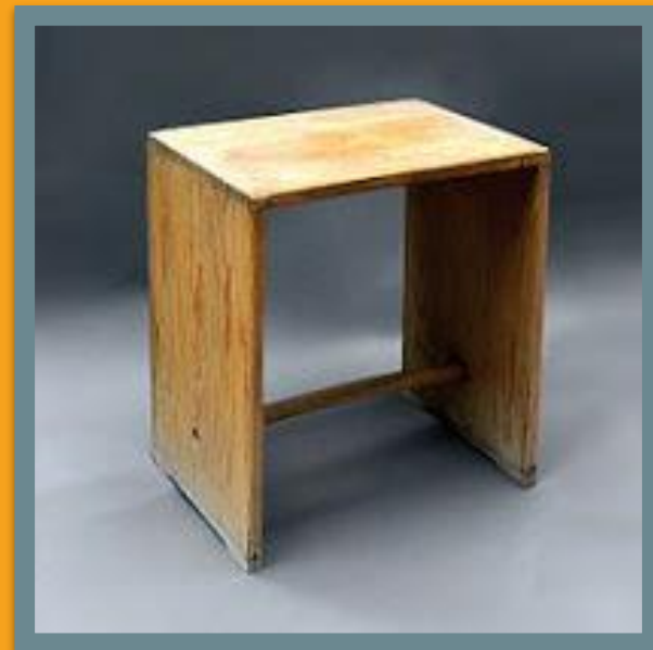
Сервиз TC100, дизайнер Hans (Nick) Roericht, 1959