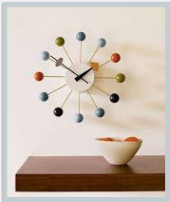
Ball Clock 1949