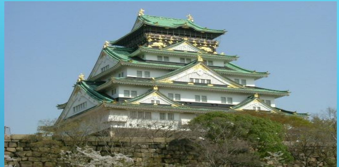
Осака, «столица Хидэёси»