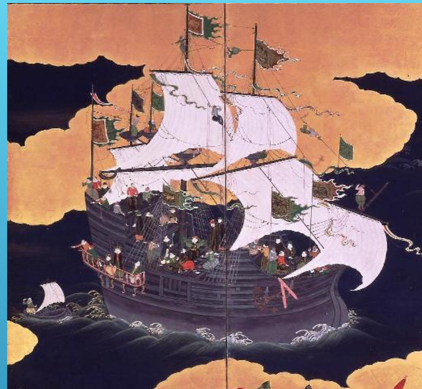
Корабль Португалии (17 век)

В Японию принялись наведываться испанские и португальские торговцы, исполняющие обязанности перекупщиков в торговле Восточной Азии, меняя товары из Европы и Китая на японское серебро. Так как европейцы приезжали из поселений на юге, японцы именовали их «южными варварами».