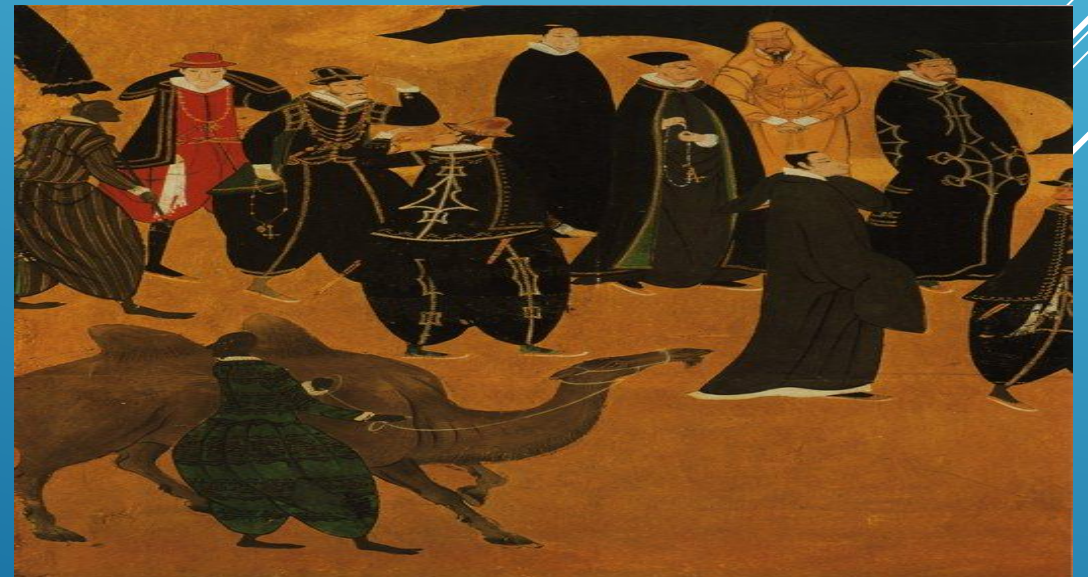
Европейцы (17 век)