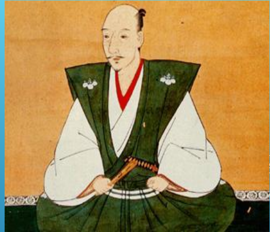
Нобунага (16 век)

В начале 16 века на Японских островах продолжались междоусобицы между самурайскими родами. После того, как разобщенность государства стала социально-политической нормой, нашлись люди, стремящиеся объединить Японию. Ими стал руководить Ода Нобунага, богатый правитель провинции Овари. При помощи сёгуна, он взял в 1570 году Киото и в течение трех лет уничтожил ослабевший сёгунат Муромати. Вследствие поддержки христианства и благодаря применению огнестрельного оружия, Нобунага за десятилетие смог захватить наиболее важный регион Кинки и весь центр Японского архипелага. С течением времени он осуществлял замысел объединения Японии: безжалостно усмирал децентрализующие возмущения аристократии и буддистов, помогал возрождению авторитета императорской власти и восстанавливал подорванную междоусобицами экономику.