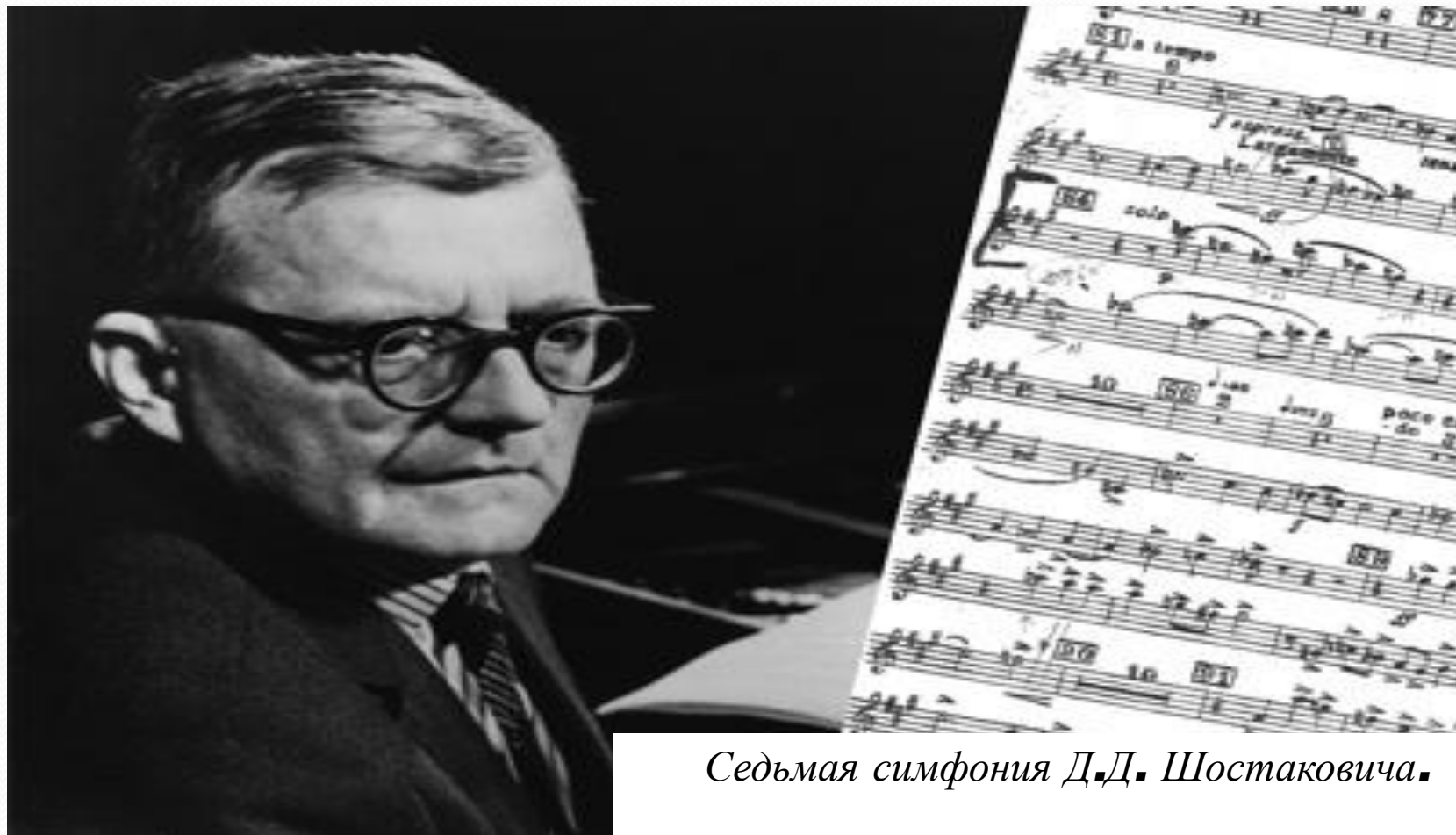
Седьмая симфония Д.Д. Шостаковича.

О каком произведении искусства одна из зарубежных газет написала: “Страна, художники которой в эти суровые дни создают произведения бессмертной красоты и высокого духа, непобедима!”