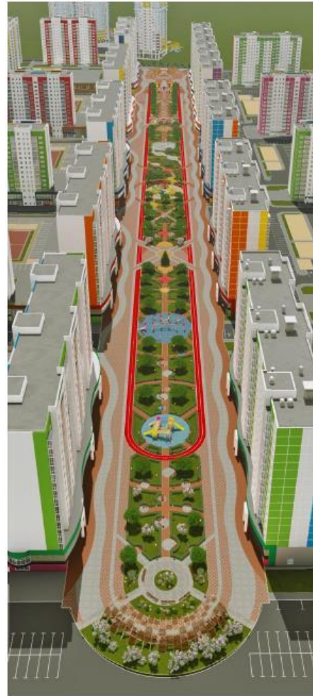
Схема застройки микрорайона соответствует современному ритму жизни.

На территории жилого района предполагается собственный пешеходный бульвар с торговой галереей.