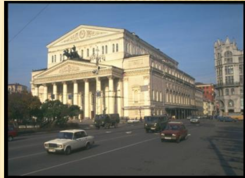
Большой театр г.Москва, 90-ые года