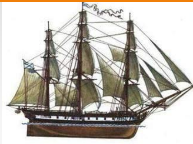
«Восток» (построен в 1818 году в Петербурге, экипаж-117 человек)

В июле 1821 г. корабли возвратились в Кронштадт, привезя огромное количество материалов и коллекций.