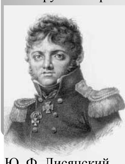
Ю. Ф. Лисянский

1803 г. – первая кругосветная экспедиция