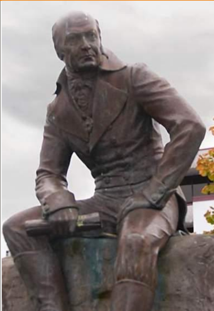
А.А.Баранов монумент в г.Ситка, Аляска

Освоение Русской Америки связано с именем А. Баранова. Купец из г. Каргополя торговал на Аляске с 1790 г. Он составил подробные карты Аляски и близлежащих островов.