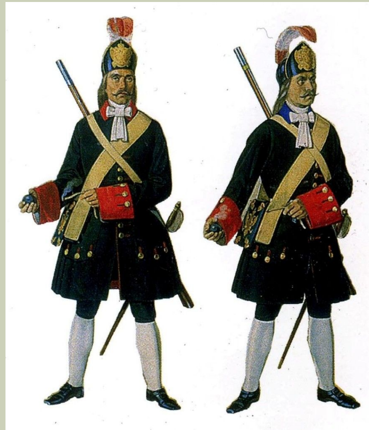
К.К. Пиратский Гренадеры гвардейских полков 1720—1730 годов. 1840—1850-е годы

Гвардейские полки ■ отборная привилегированная часть войск, ■ опора власти, ■ состав – дворяне.