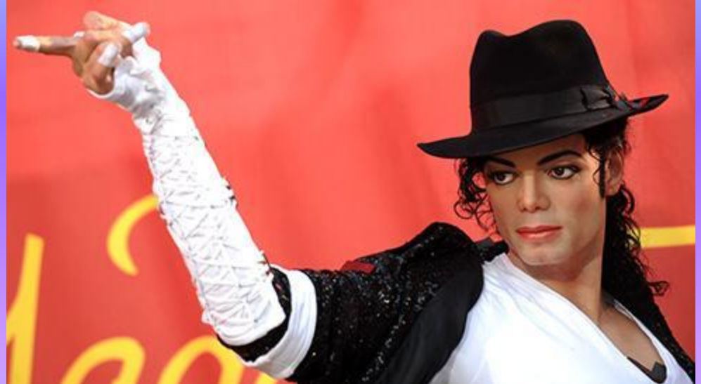
Восковая фигура Майкла Джексона