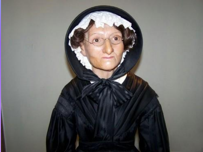
Восковая фигура мадам Тюссо