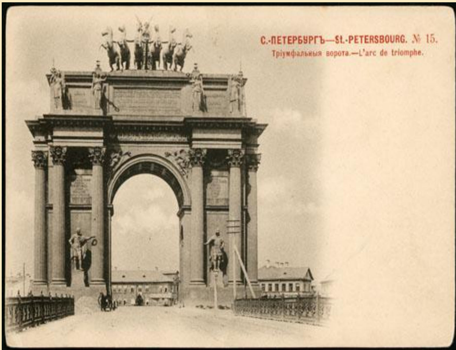
С.-ПЕТЕРБУРГЪ—St.-PETERSBOURG. № 15. Триумфальная ворота.—L'arc de triomphe.