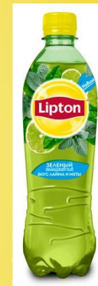
Лайм и Мята