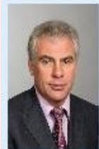
Александр Матыцын Вице-президент, начальник Главного управления казначейства и корпоративного финансирования