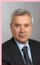
Вагит Алекперов Президент Компании