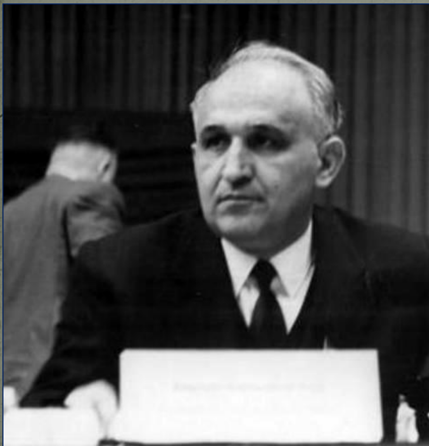
«Отец всех болгар» Тодор Живков. Правитель Болгарии с 1954 по 1989 гг.

«Реальный социализм» оказался тупиковой ветвью развития. К концу 80-х гг. в связи с перестройкой в СССР в странах Восточной Европы проходят «бархатные революции» свергающие коммунистические правительства.