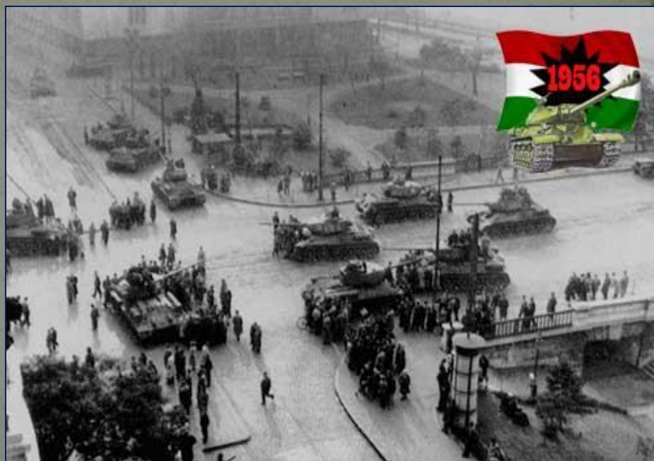
Венгрия. 1956 г.