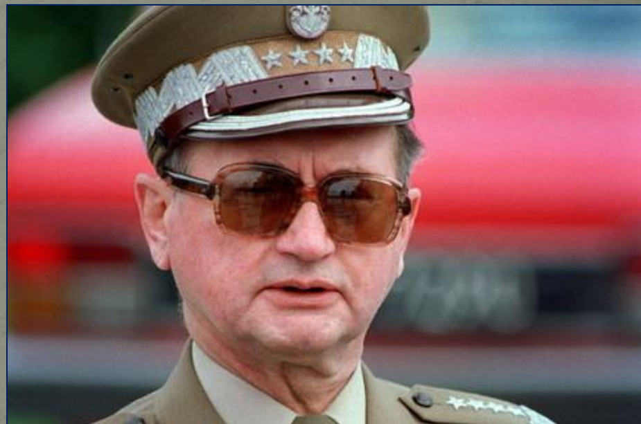
Генерал Войцех Ярузельский, введший в Польше ЧП и правившей ею с 1981 по 1990 г.