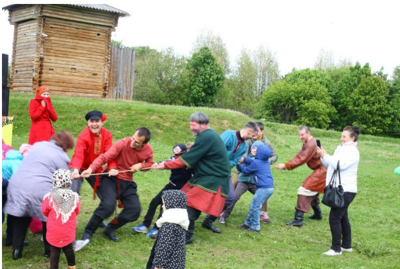
Командные игры и демонстрация быта