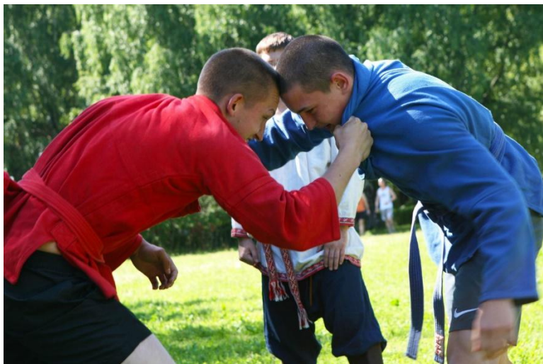
Старинная русская борьба «За вороток»