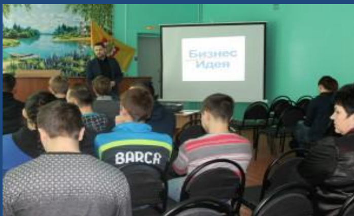
Тренинг для студентов «Где найти идею для бизнеса. Анализ рынка.»