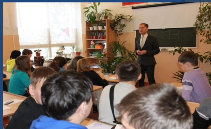
Тренинг «Лидерские технологии»