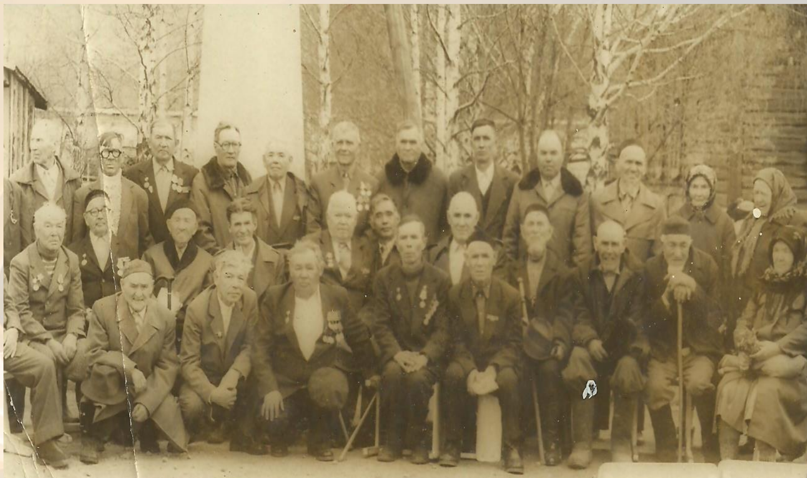
Ветераны деревень Средний Баяк, Верхний Баяк и Куянково, 1976 г.