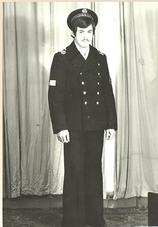
Захит-моряк Балтийского Флота, 1976 -79 гг.