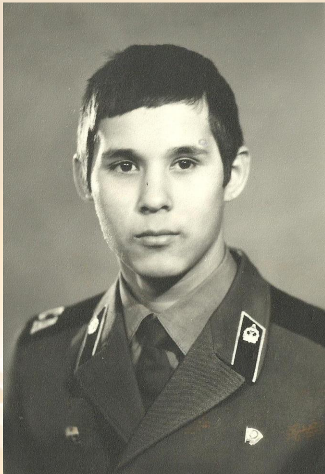
Вазик – инженерные войска, Ступино, Московская обл. 1979-81гг