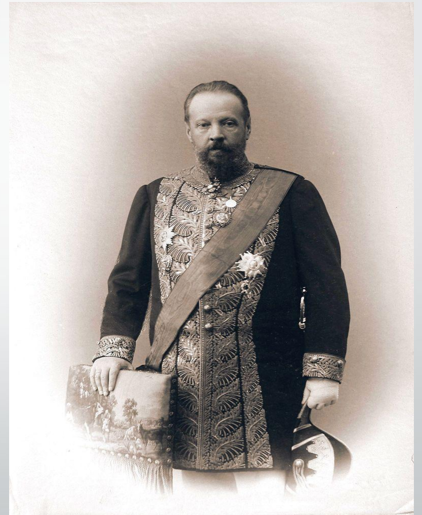
Витте, Сергей Юльевич — Википедия

Витте Сергей Юльевич родился 17 июня 1849 г. в семье обрусевших немцев. Юность его прошла в Тифлисе. В 1870 г. Витте окончил Новороссийский университет, став кандидатом физико-математических наук. Но из-за нехватки средств он предпочел научной карьере работу на одесской железной дороге. Начав с низших постов, он скоро дослужился до должности управляющего юго-западными железными дорогами. Прекрасно проявив себя и в дальнейшем, он в 1892 г. занял высокий пост министра финансов.