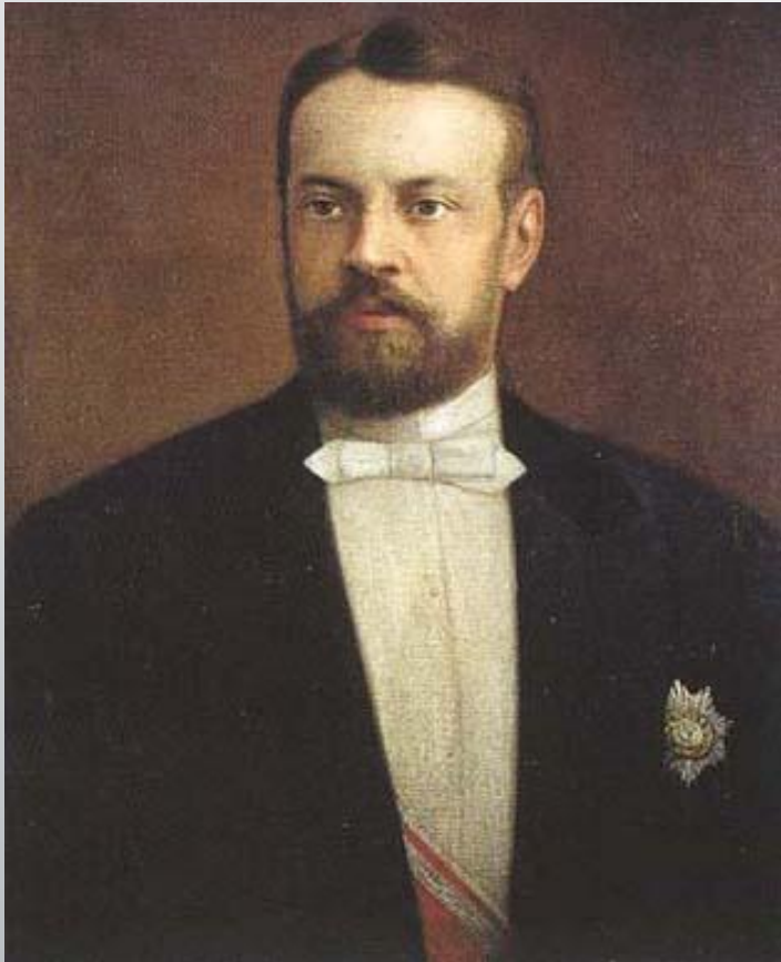
Витте, Сергей Юльевич — Википедия