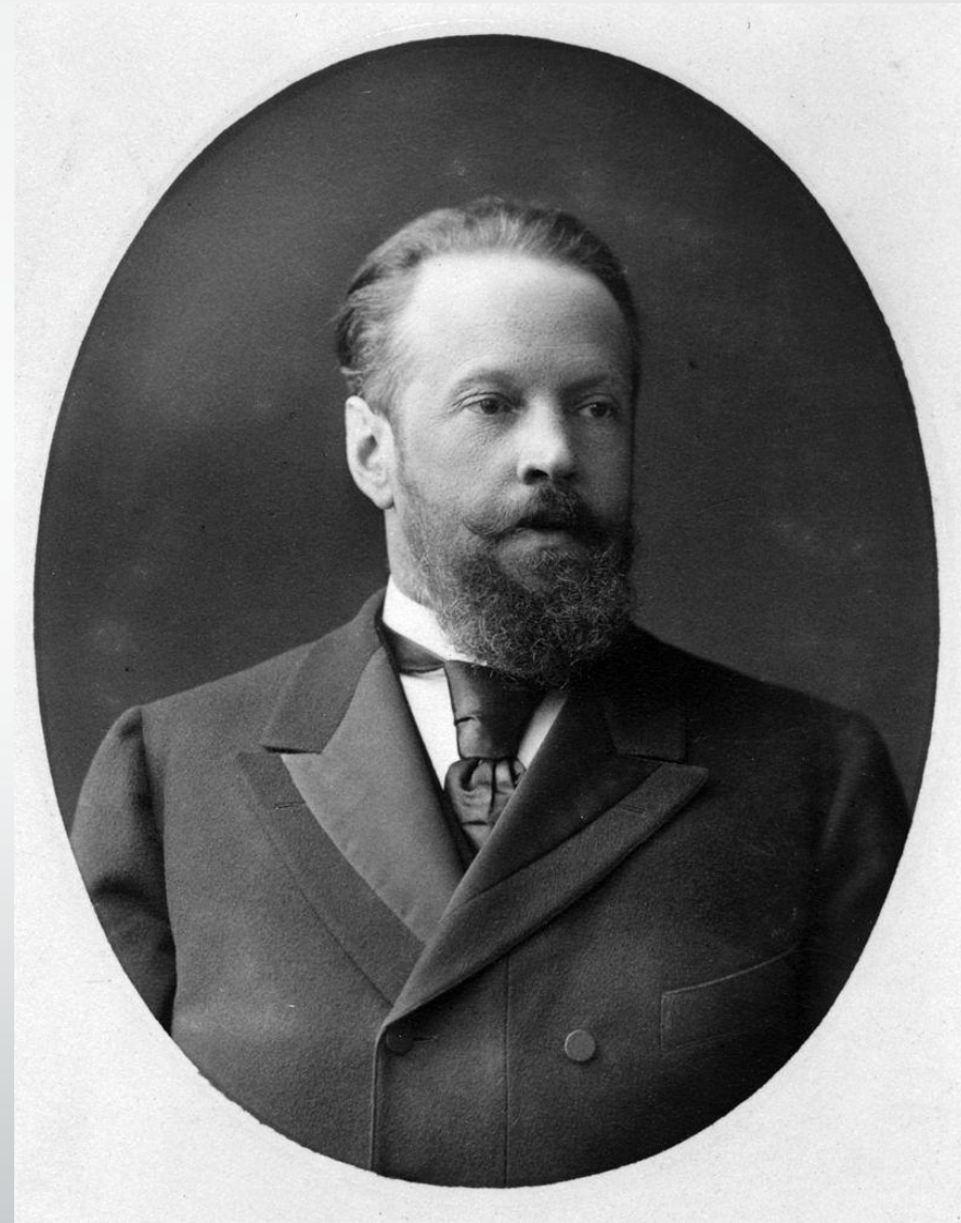
Витте, Сергей Юльевич — Википедия

русский государственный деятель, министр путей сообщения (1892), министр финансов (1892—1903), председатель Комитета министров (1903—06), председатель Совета министров (1905—06). Добился введения в России « золотого стандарта » (1897), способствовал притоку в Россию капиталов из-за рубежа, поощрял инвестиции в железнодорожное строительство (в том числе Великий Сибирский путь ). Деятельность Витте привела к резкому ускорению темпов промышленного роста в Российской империи . Противник начала войны с Японией и главный переговорщик при заключении Портсмутского мира . Фактический автор манифеста 17 октября 1905 года , который предполагал начало трансформации России в конституционную монархию . По чинам — действительный тайный советник (1899). С 1903 член Государственного совета . Автор многотомных воспоминаний.