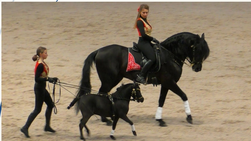
Мини-лошадь и лошадь

Познакомимся с многообразием декоративных животных.