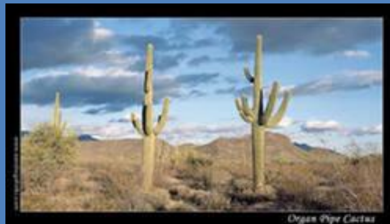
Organ Pipe Cactus