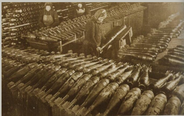
В годы ВОВ на площадях завода изготавливали продукцию для военных нужд

С первых дней Великой Отечественной войны завод прекратил выпуск гражданской продукции и перестроил свои мощности на крупносерийное производство для нужд оборонной промышленности. Изготавливали бронекорпуса танка Т-34 и фюзеляжей самолетов – штурмовиков ИЛ-2, корпуса снарядов для «Катюш»