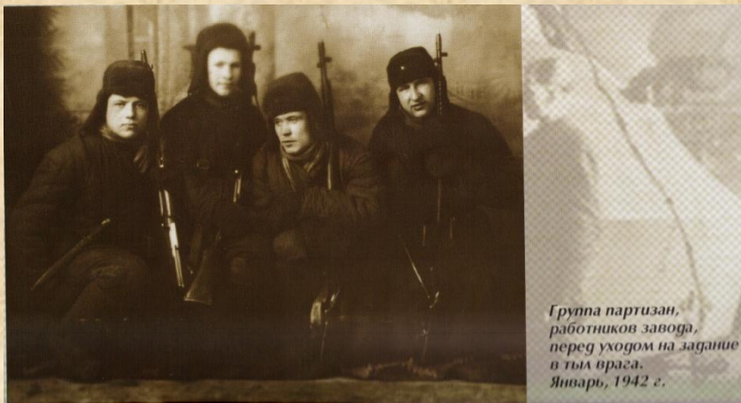
Группа партизан, работников завода, перед уходом на задание в тыл врага. Январь, 1942 г.

Комсомольцы-заводчане организовали партизанский отряд и ходили на задание в тыл врага осенью 1941 года