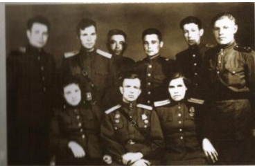
Личный состав бронепоезда «Подольский рабочий» перед расформированием (слева направо)

Вскоре с фронта пришло на завод письмо. В нем сообщалось, что личный состав бронепоезда в первом же бою успешно выполнил поставленную командованием задачу: полностью разгромил укрепленную высоту. Разбито 32 дзота, уничтожено две артиллерийские батареи и до двух батальонов пехоты.