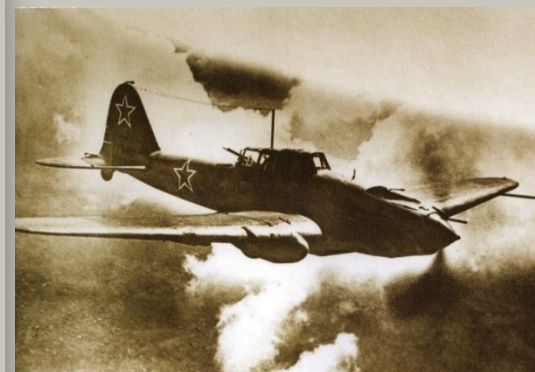
Самолеты – штурмовики ИЛ-2 укрепили броней на ЗиО

16 октября 1941 года началась эвакуация завода на Восток. 1 ноября 1941 года завод полностью эвакуировал оборудование, оставив необходимое для изготовления бронепаровозов, противотанковых ежей, лопат, подков для лошадей.