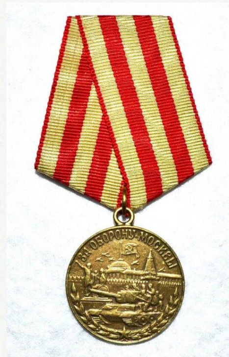
За оборону Москвы.