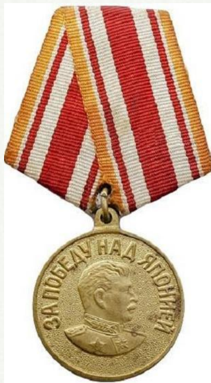
За Победу над Японией.