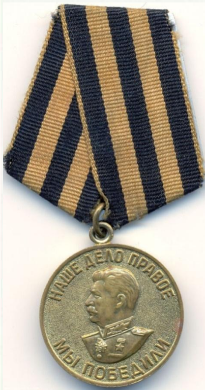
За Победу над Германией.