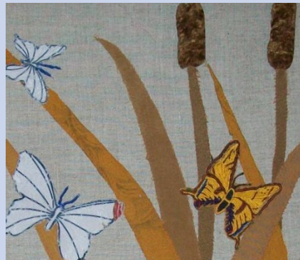
Рисунок с журнала срисовала на ватман.

Панно «Бабочки в камышах» выполнено в смешанной технике. Здесь сочетаются машинная и ручная аппликации.