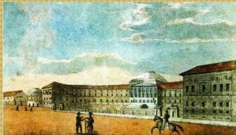
Московский университет нравственно-политическое отделение