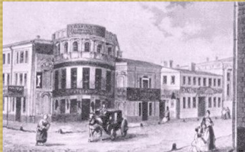
Московский университетский Благородный пансион

Затем в жизни Лермонтова проходило обучение в Московском университете (1830-1832). В это время Лермонтов сильно увлекался произведениями Фридриха Шиллера и Уильяма Шекспира и Джорджа Байрона. После учебы в университете он два года провел в школе гвардейских подпрапорщиков Петербурга.