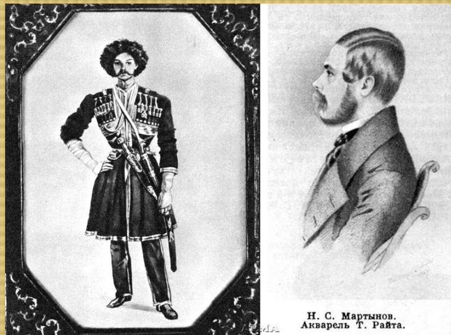
Н. С. Мартынов. Акварель Т. Райта.

В Пятигорске, возвращаясь со второй ссылки, Лермонтов встретил старого товарища Мартынова. Тот, оскорбившись на злую шутку поэта, вызывает Лермонтова на дуэль. 15 (27) июля 1841 года на этой дуэли Лермонтова настигла смерть.