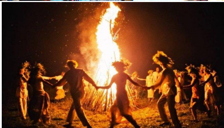
Ночь на Ивана Купала