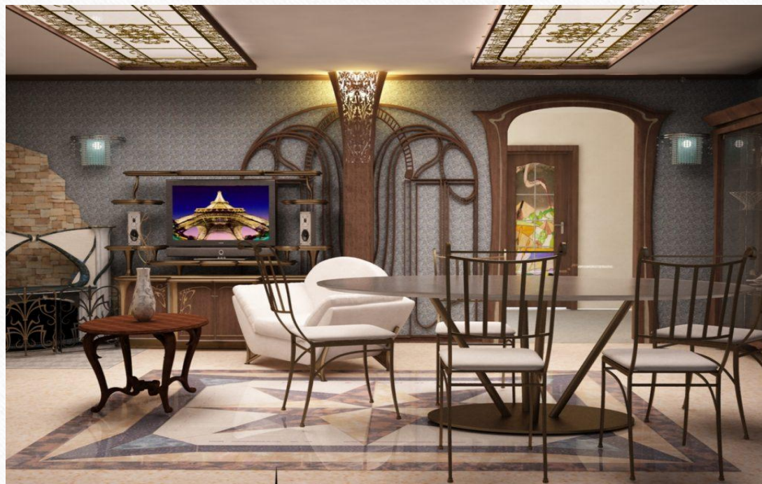
Фото гостиной в стиле модерн

Большую роль в формировании интерьеров стиля модерн сыграло появление электричества в 1900 году. Искусственное электрическое освещение оказало влияние на цветовидение интерьеров.