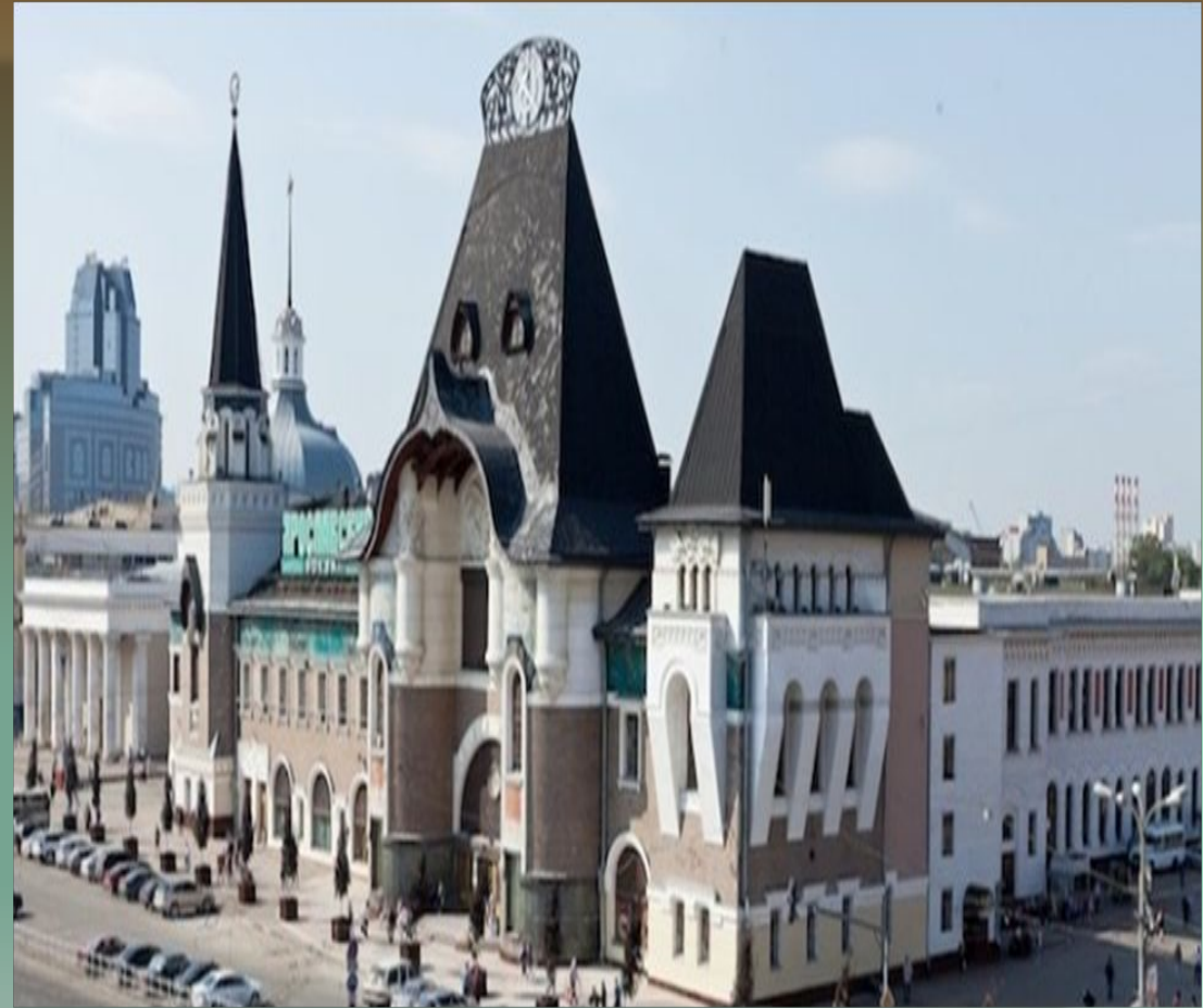
Здание Ярославского вокзала по проекту Ф.О. Шехтель