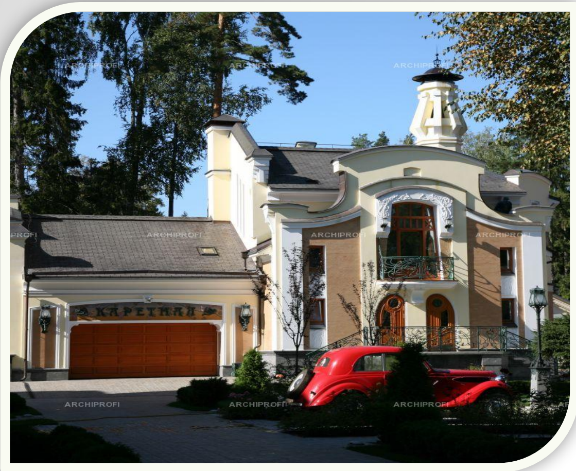
Особняк в стиле модерн