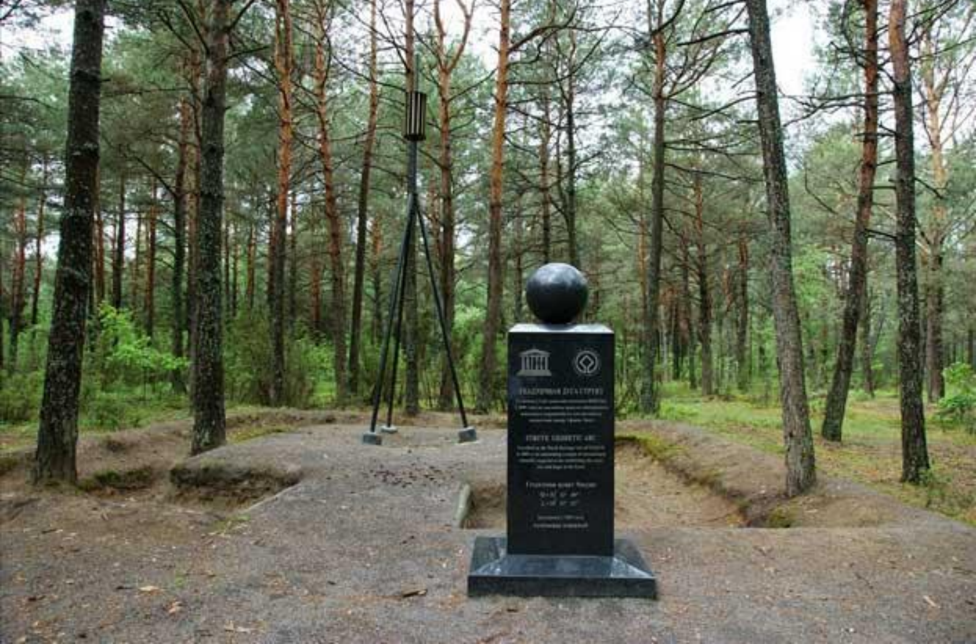
Геодезическая дуга Струве