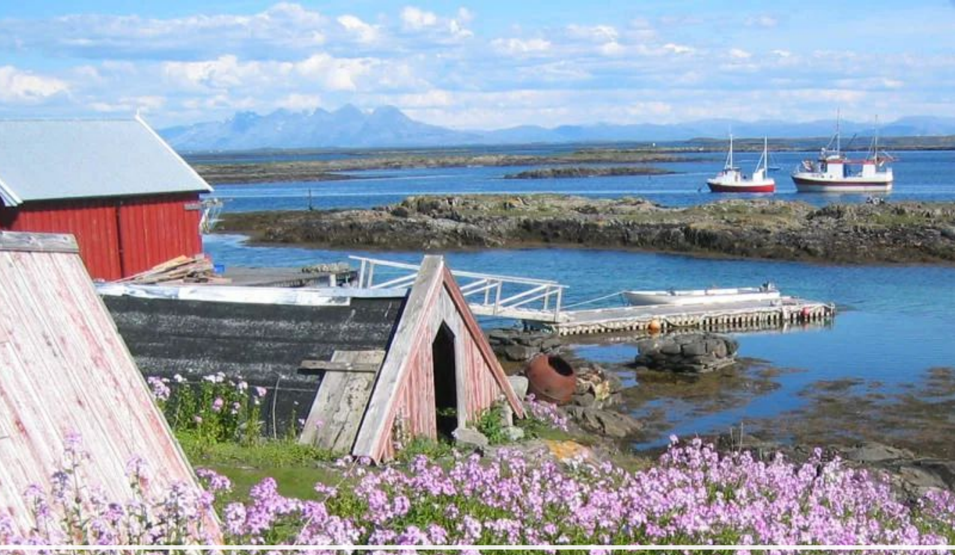
Вегаэйн – архипелаг Вега