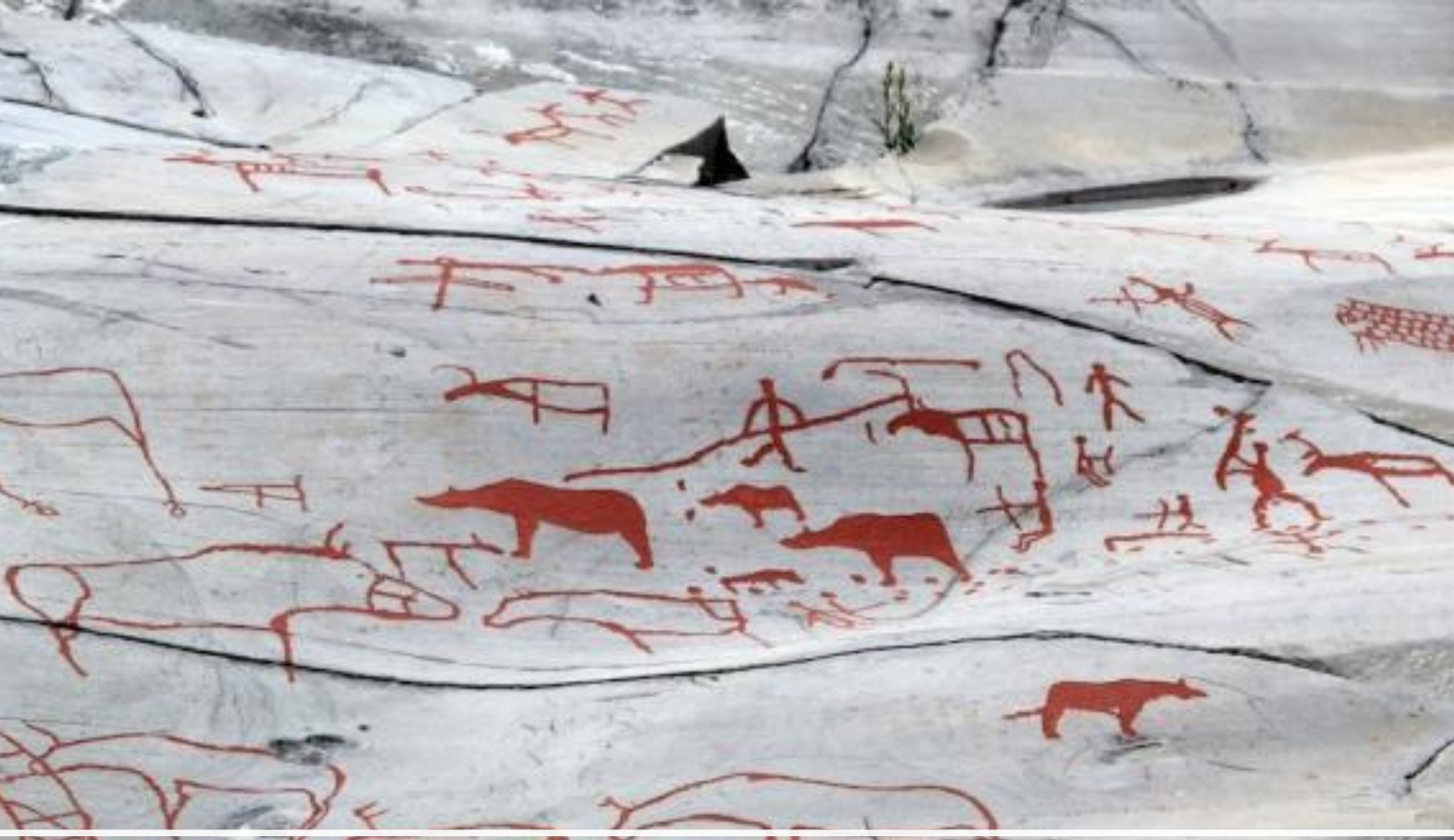
Наскальные рисунки в Альте