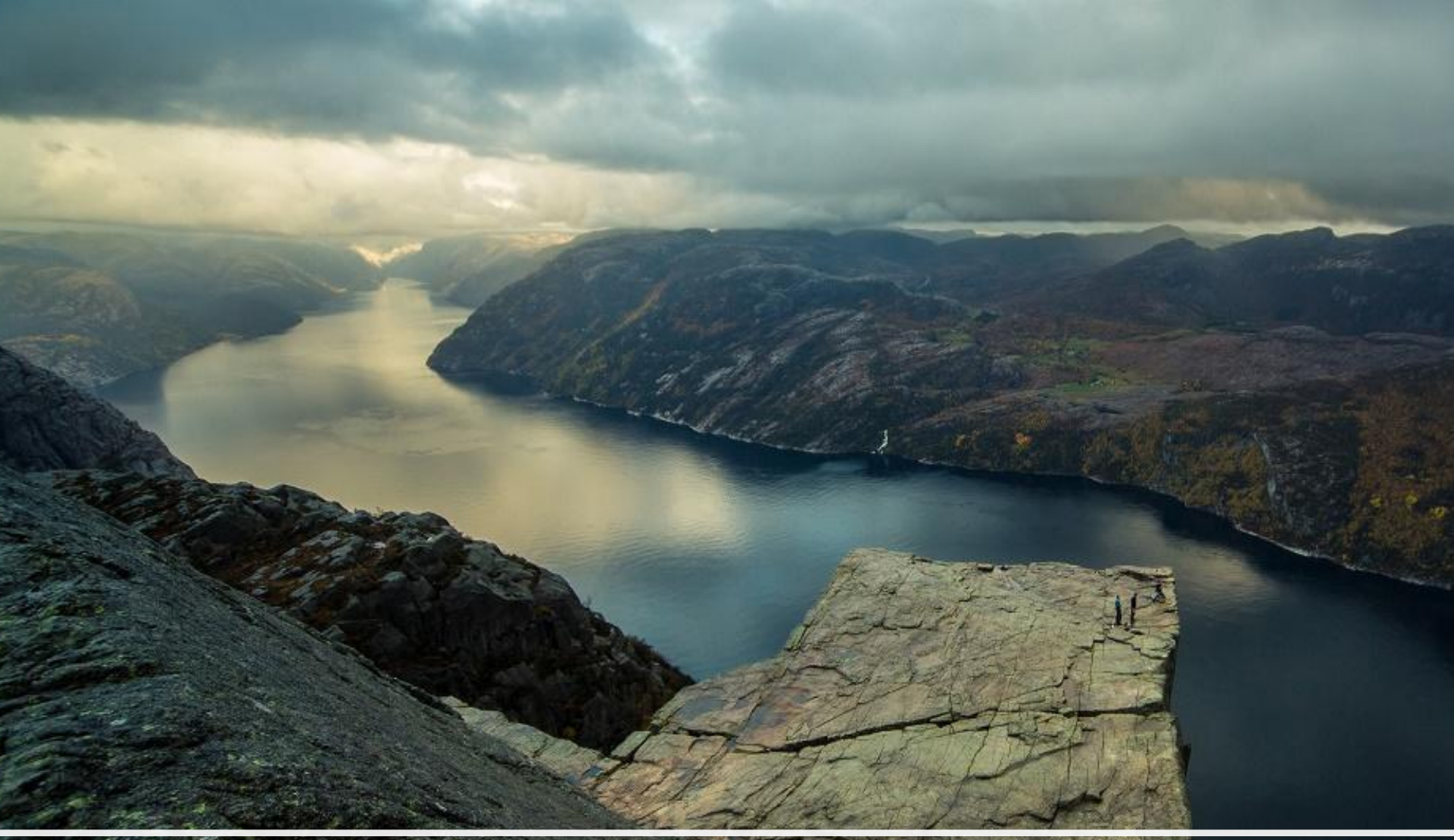
Фьорды западной Норвегии