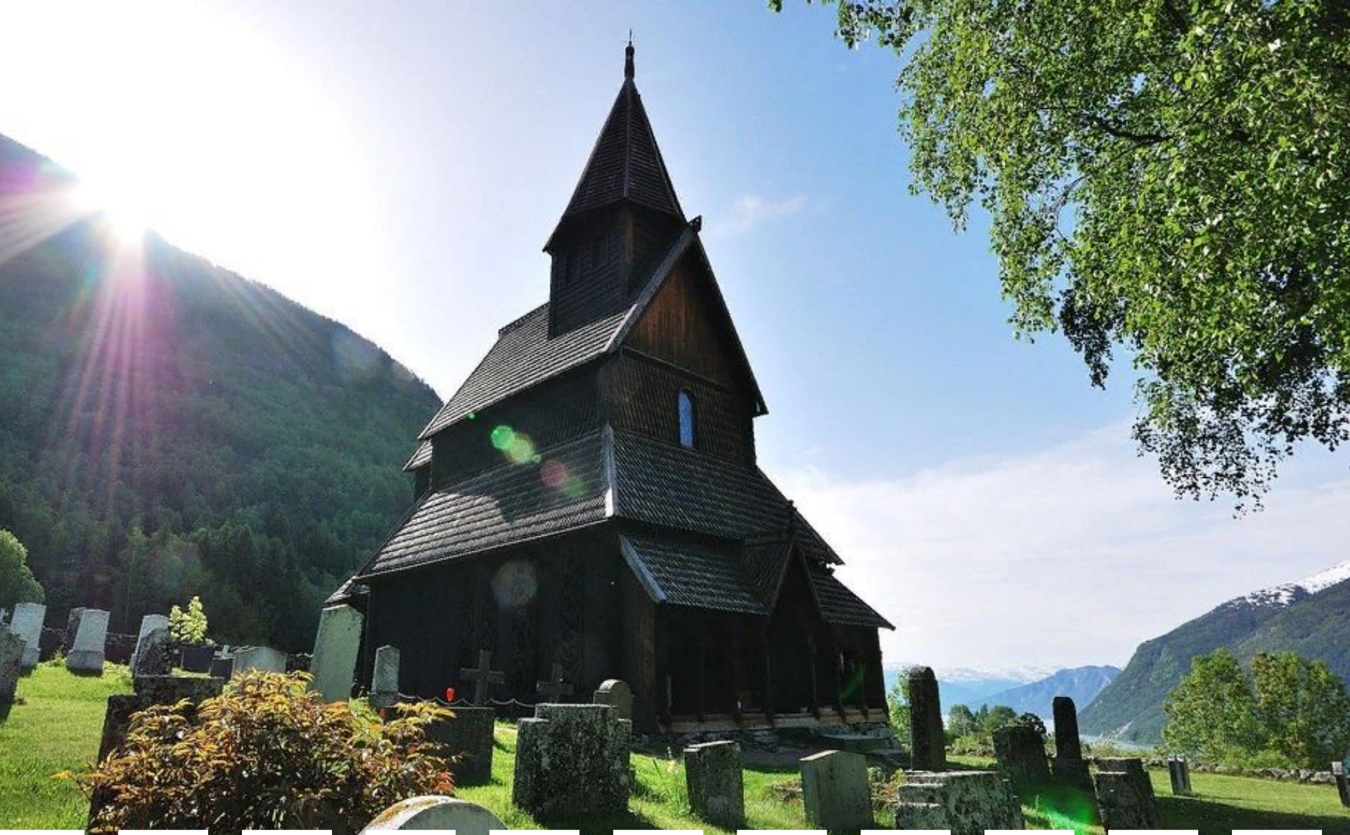
Ставкирка в Урнесе (Каркасная церковь XII-XIII вв.)