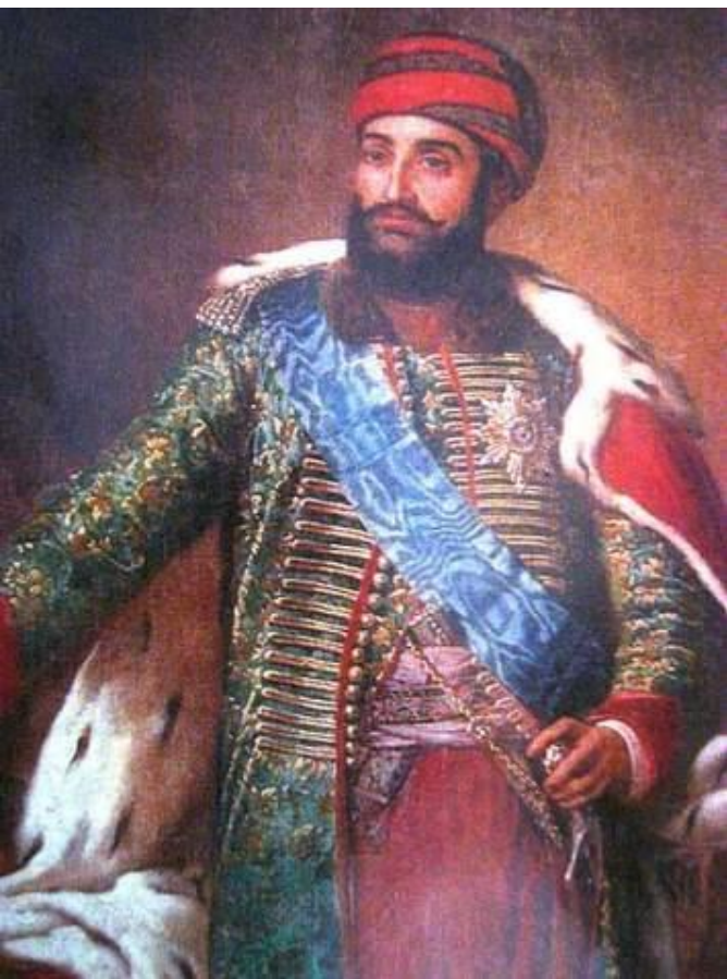
Ираклий II, царь Картли-Кахети

В конце 1782 года царь Восточной Грузии (Картли-Кахети) Ираклий II, стремясь спасти Грузию от турецких и персидских набегов, обратился к Екатерине II с просьбой принять его царство под покровительство России.