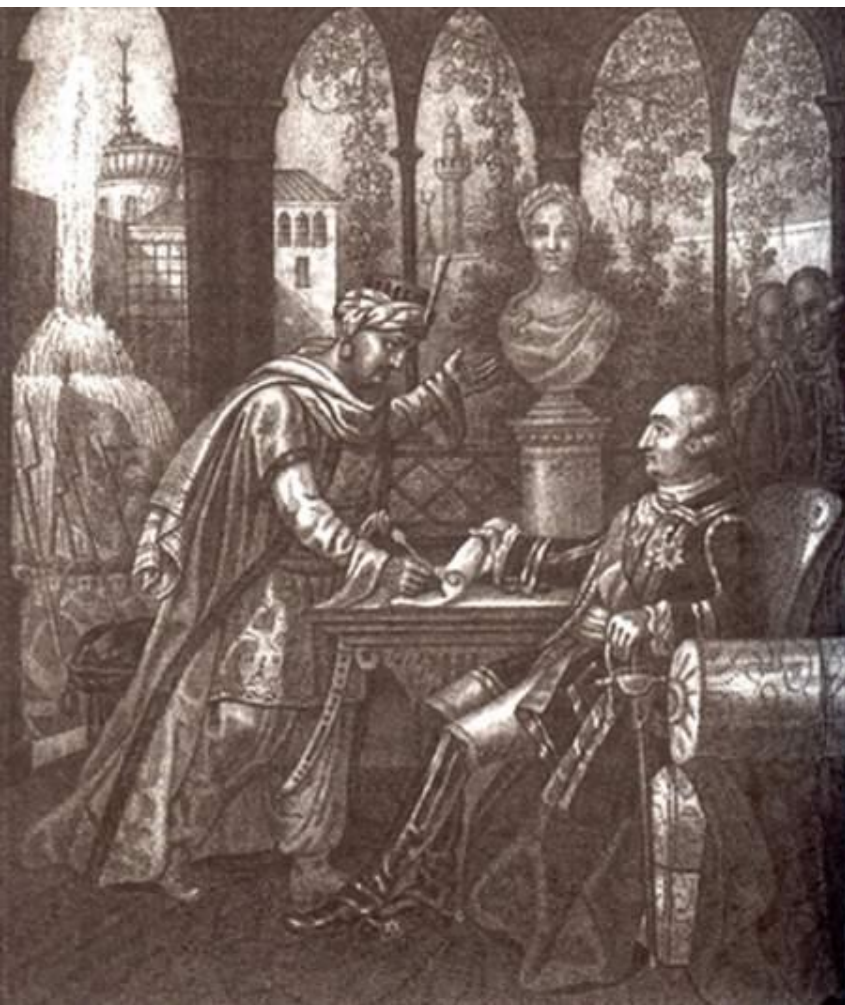
Князь Потемкин принимает Крым в подданство России. Худ. Б. Чориков.

После Кючук-Кайнарджийского мира – продолжение борьбы между Россией и Турцией за влияние на Крым.