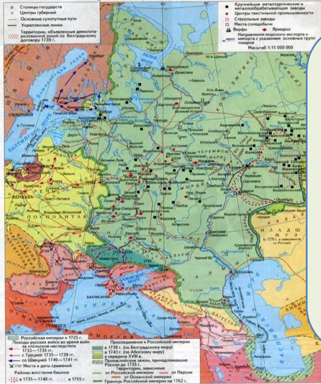
Российская империя в середине XVIII в. (Европейская часть)