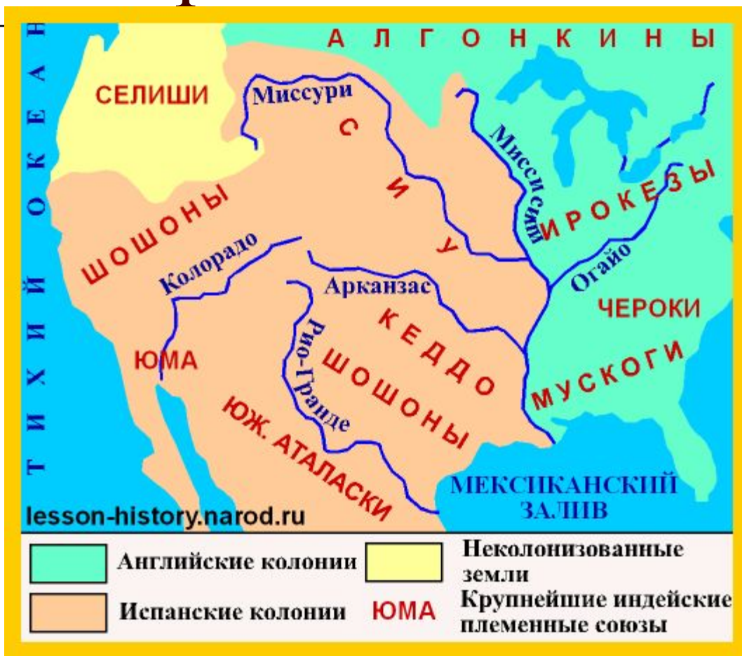
Расселение индейских племен в Северной Америке.