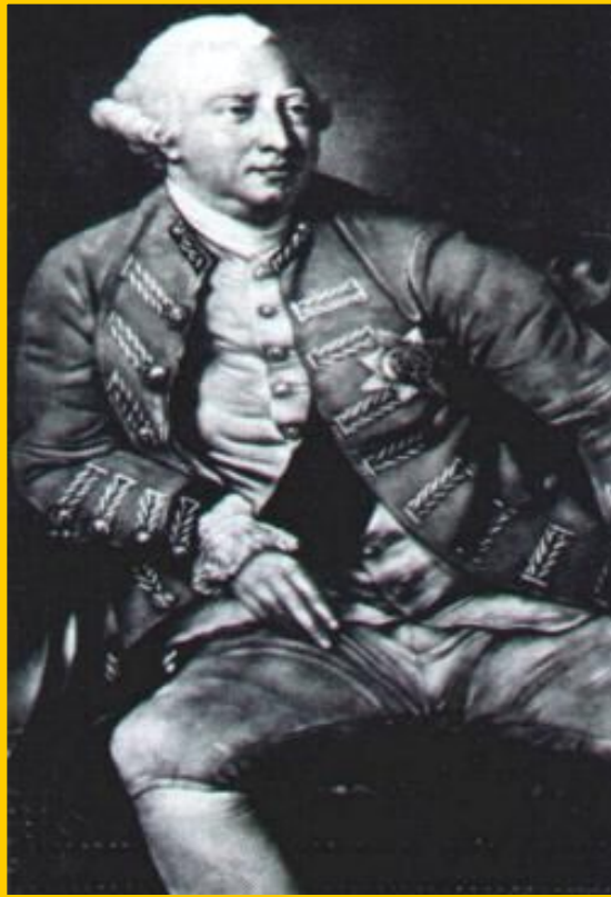
Король Георг III. Гравюра 18 в.

Король запретил переселение на новые земли, переработку в колониях сырья, вывоз шерсти и железа, ввоз машин, их моделей и чертежей. Торговать колонии могли только с Англией. Колонии стали обвинять короля в тирании и выдвигать идеи создания правового государства.