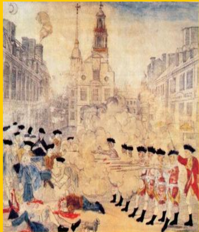
Неизвестный художник. Бостонский расстрел.

Тогда колонисты бойкотировали английские товары и парламент отменил все пошлины, кроме «чайной». В 1773 г. Ост-Индская компания попыталась сбыть большую партию чая. Бостонские агенты решили его приобрести. Тогда группа колонистов под видом индейцев устроила «Бостонское чаепитие».