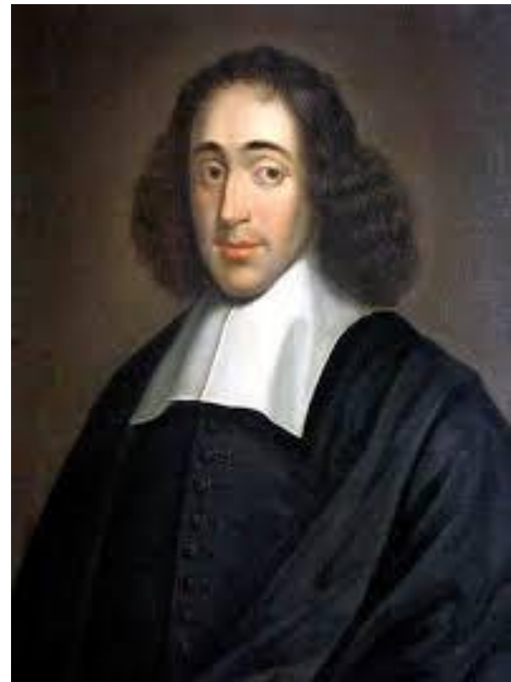
Барух Спиноза (1632-1677)