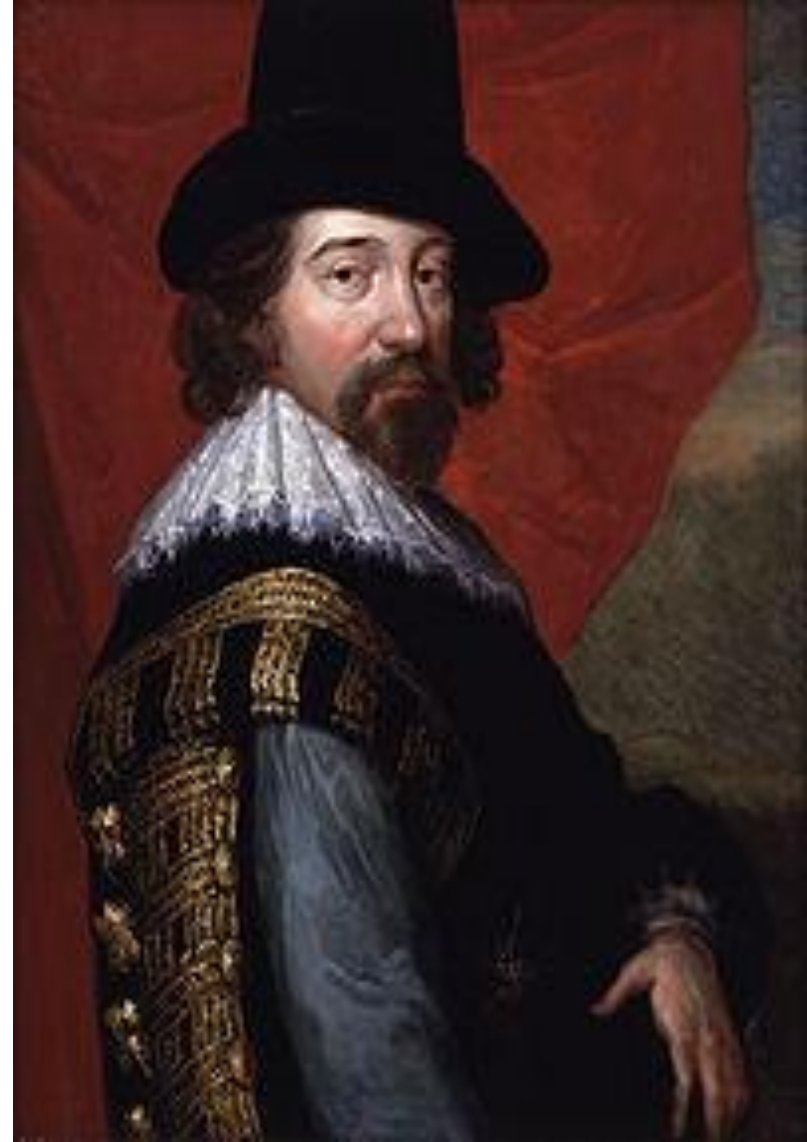
Фрэнсис Бэкон (1561-1626)

Бэкон философия ғылымының практикалық функциясына ерекше көңіл бөледі. Оның ойынша, философия ғылыми білімдердің көмегі арқылы адамға табиғатты игеруге көмектесуі қажет. Әйгілі “Білім-күш” “Күш-білім” деген қағиданың авторы Бэкон еді. Оның пікірінше, философияның негізгі зерттеу объектілері- құдай, табиғат және адам. Бэкон философияны табиғи философия деп түсінеді, оның өзін теориялық және практикалық деп бөледі. Біріншісі табиғат құбылыстарының себептерін түсіндірсе, екіншісі теориялық жаңалықтарды пайдалана отырып, адамға қажетті жаңалықтар ашады. Табиғи философияны Бэкон физика және метафизика деп жіктейді, оның негізінде- Аристотельдің себептілік ілімі.