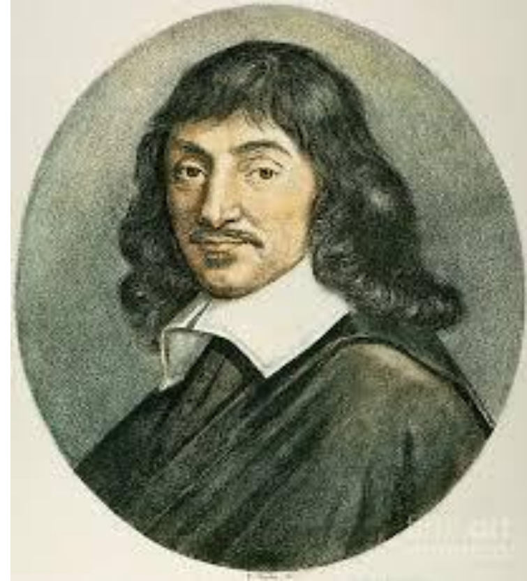
Рене Декарт (1596-1650)