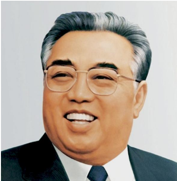
Ким Ир Сен