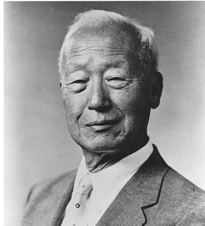
Ли Сын Ман

Коммунистическое правительство Ким Ир Сена и проамериканское южнокорейское правительство Ли Сын Мана претендовали на власть над всей Кореей.