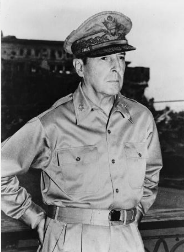
Дуглас Макартур 1880–1964 гг.