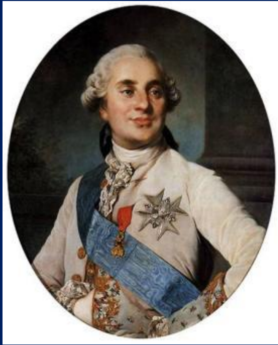
Людовик XVI (1754 – 1793)