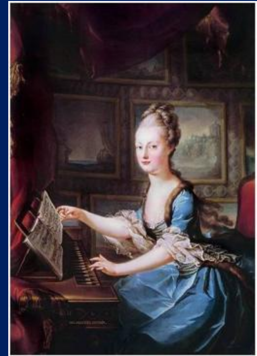
Мария-Антуанетта (1755 – 1793)