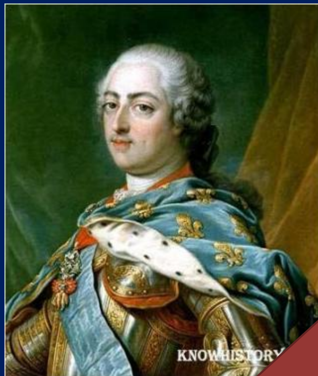
Людовик XV (1715 – 1774)

«Только в одной моей особе пребывает королевская власть. Весь общественный порядок во всем его объеме исходит от меня, интересы и права нации — все здесь, в моей руке.