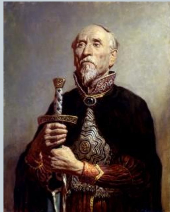
Русский воевода. Худ. С. Кириллов