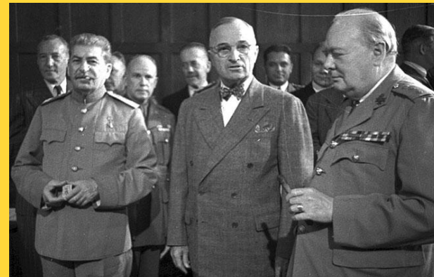
июль 1945, Потсдам

власть осуществляется Главными командующими окупационными силами