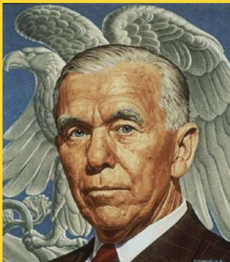
Джордж Катлетт Маршалл