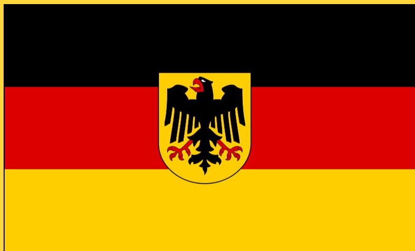
Правительственный флаг с 7 июня 1950

8 мая 1949 года собравшийся в Бонне Парламентский совет , состоящий из представителей земель в зонах оккупации США, Великобритании и Франции, принял Основной закон Германии , которым установлено: «Федеральный флаг — чёрно-красно-золотой» , и 9 мая 1949 года, впервые на территории Германии после 1933 года, чёрно-красно-золотой флаг был поднят над зданием, где заседал Парламентский совет. Основной закон вступил в силу 23 мая 1949 года.