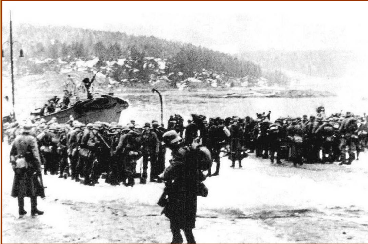
Высадка немецких войск в Норвегии

В апреле 1940 г. немцы вторглись в Данию и Норвегию. Дания сдалась без сопротивления. Норвежские войска оказали упорное сопротивление, но оставшись без поддержки своих союзников-англичан, были разгромлены, а страна оккупирована немцами.