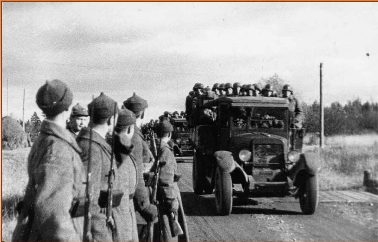
Ввод советских войск в Прибалтику

Под угрозой вторжения Латвия, Литва и Эстония согласились разместить на своих территориях советские военные базы, и в июне 1940 г. советские войска заняли Прибалтику.