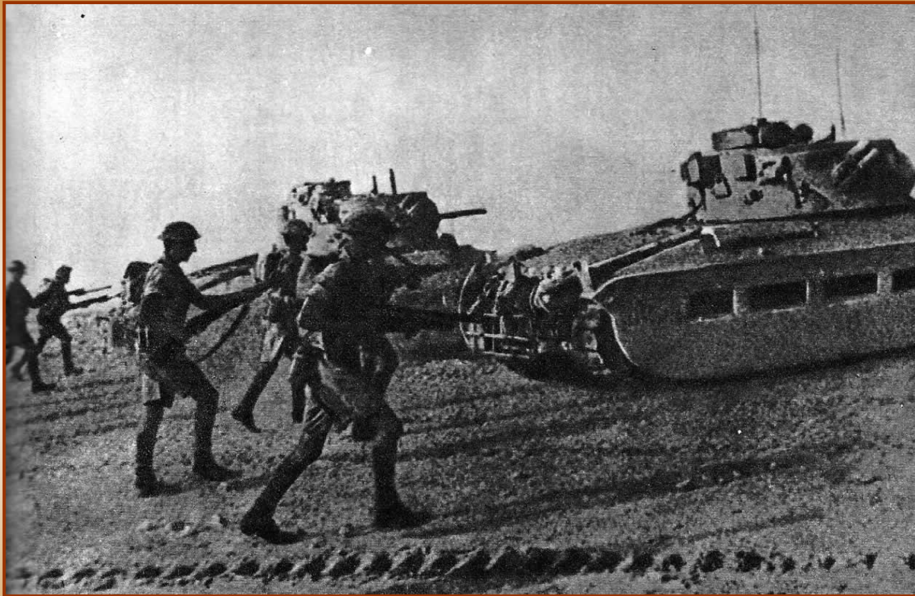
Английские солдаты в Африке

Германия и Италия попытались захватить Суэцкий канал, чтобы прервать связь Британии с колониями, но их войска завязли в боях на Ливийско-египетской границе.