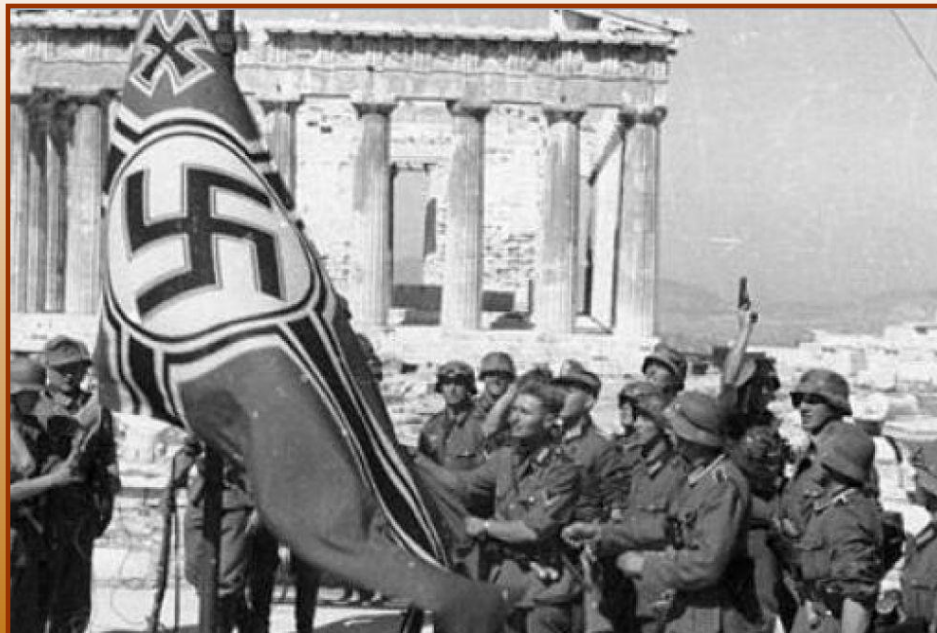
Немецкие войска в Афинах

1941 г. – захват Германией Югославии и Греции