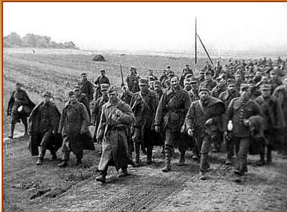
Пленные польские солдаты

17 сентября 1939 г. Сталин объявил «Мирный поход» по освобождению западных украинцев и белорусов.