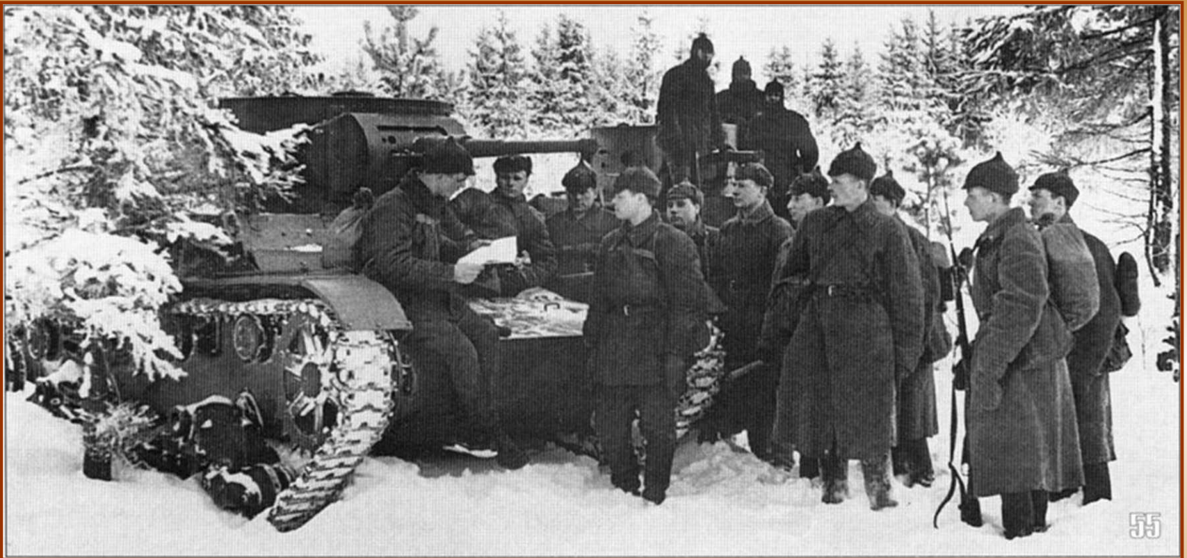
Советские солдаты в Финляндии

Советский союз начал территориальные захваты в «своей» зоне влияния. Война 1939-1940 гг. привела к территориальным уступкам со стороны Финляндии, но ей удалось сохранить независимость.