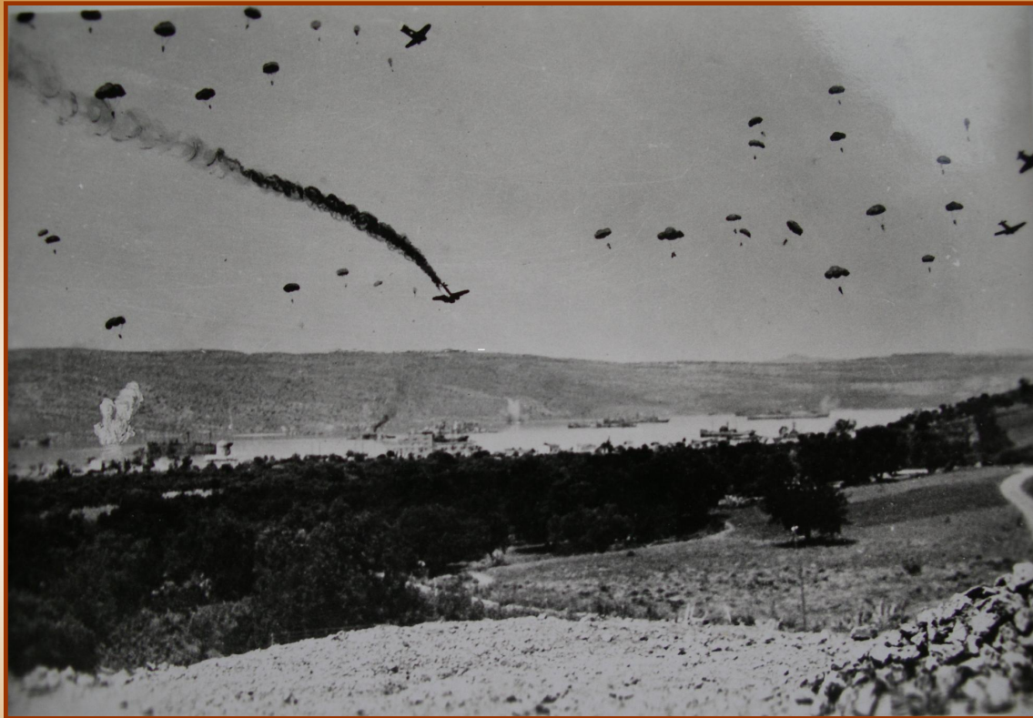
Немецкий десант на Крит

Англичане пытались создать плацдарм на Средиземном море на о.Крит. В конце мая, неожиданно для англичан, на остров был высажен воздушный десант немецких войск. Остров был захвачен.