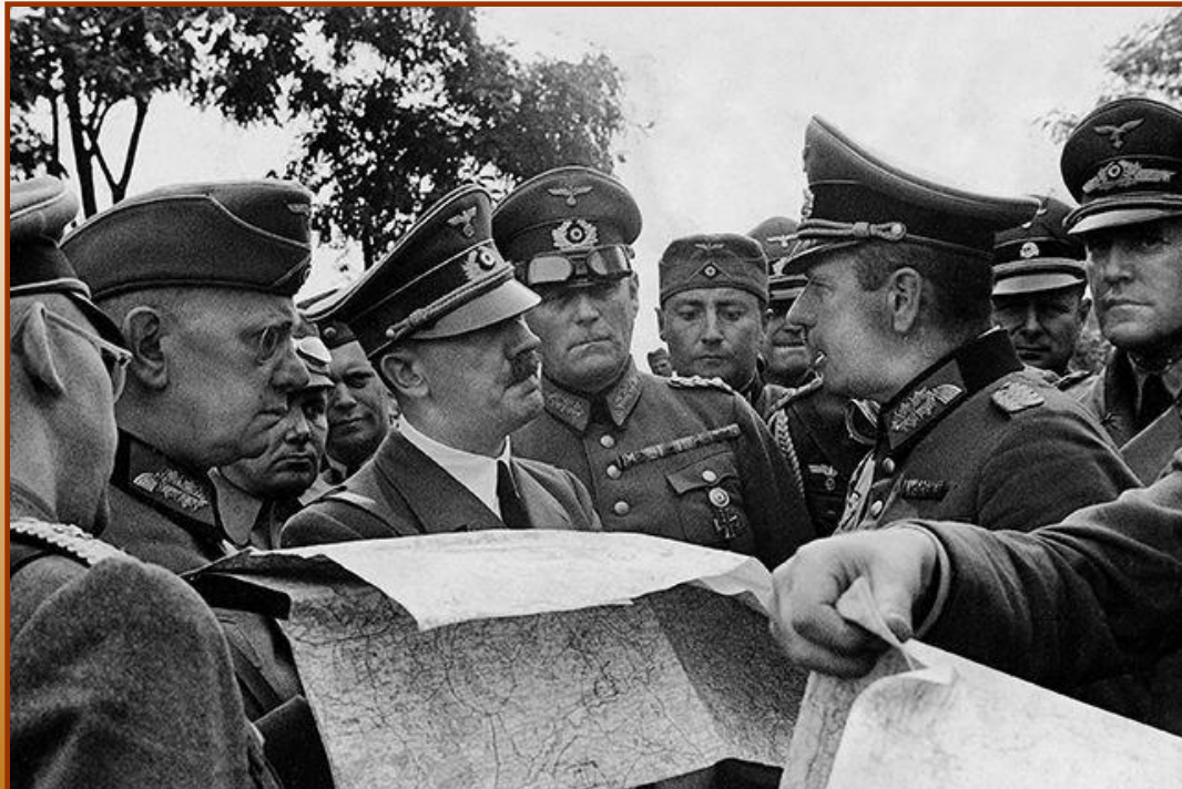
А.Гитлер инспектирует войска