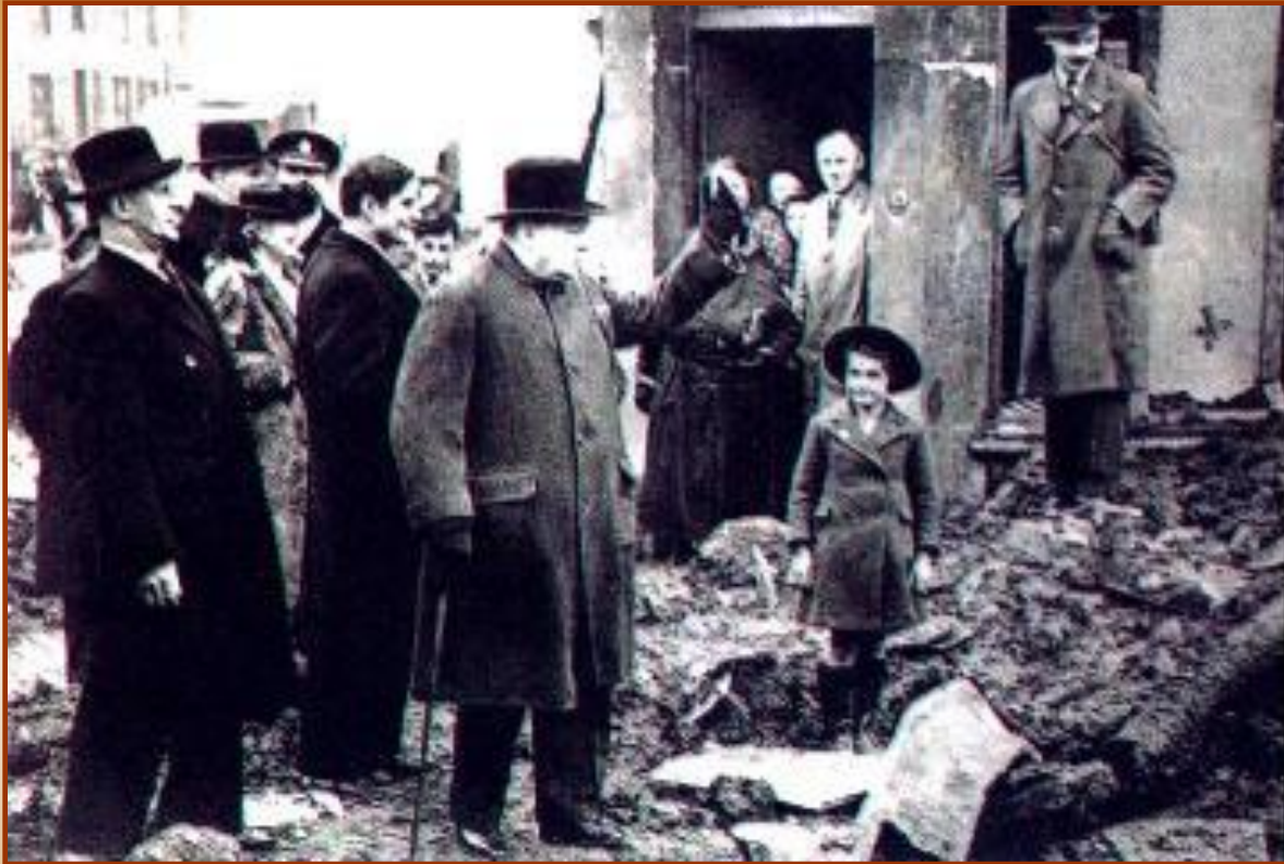
Черчилль на развалинах после немецких бомбардировок

Гитлер планировал высадить десант на Британские острова, но страну прикрывал мощный британский флот. В середине 1940 г. Германия начала массовые бомбардировки Англии. Английские ВВС и ПВО смогли дать немцам достойный отпор.