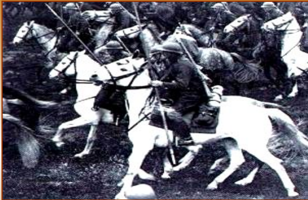
Атака польской кавалерии

Гитлер бросил против Польши 2/3 вооруженных сил, имевших абсолютное техническое превосходство.