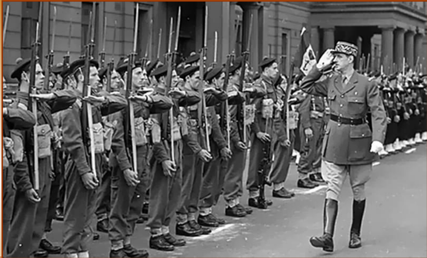
Генерал Шарль де Голль перед отрядами французских солдат, отправляющихся в Англию

Часть французских войск во главе с генералом Шарлем де Голлем отказалась сложить оружие и эвакуировалась в Англию, где совместно с союзниками продолжила борьбу против фашизма.