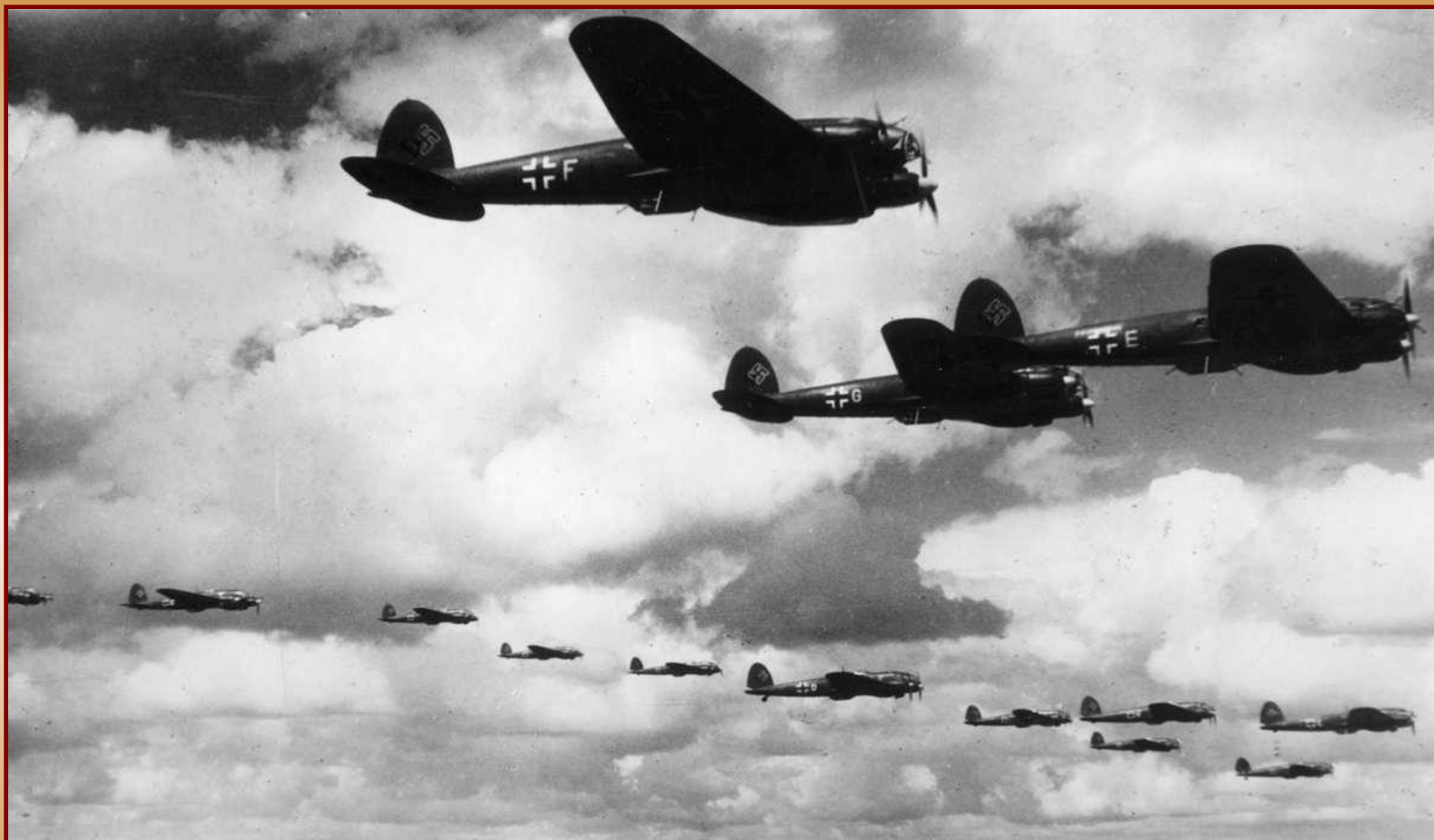
Немецкие самолеты над Англией