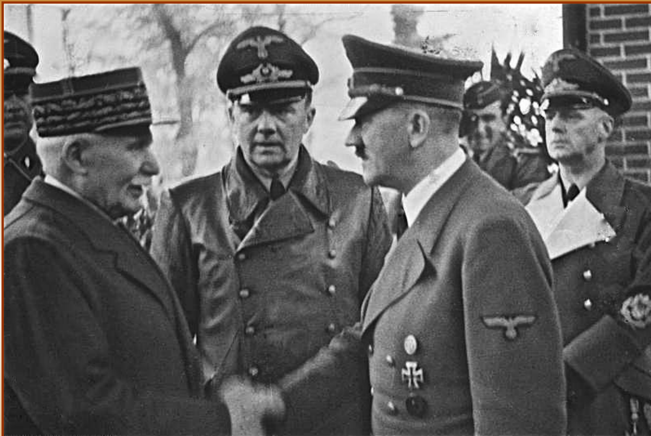
Гитлер и Петен

Маршал Петен в Компьенском лесу подписал перемирие по которому Франция разоружалась, ее север и запад оккупировался Германией. На юге Франции создавалось марионеточное государство во главе с Петеном (столица Виши).