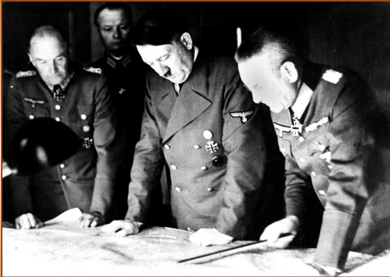
Гитлер над планом «Барбаросса»

Несовместимость интересов СССР и Германии вели их к неизбежному столкновению. В декабре 1940 г. Гитлер утвердил план нападения на СССР – «Барбаросса».