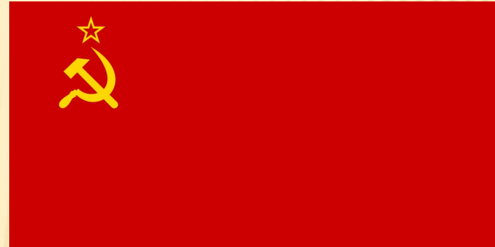
Прапор СРСР: 1923 —1991рр.