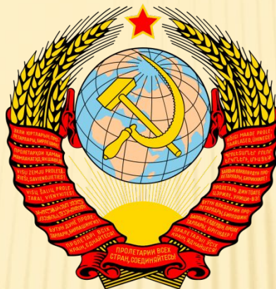
Герб Радянсько го Союзу з 1958 по 1991 роки