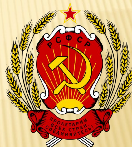
Герб РСФСР з 1978 по 1992 роки