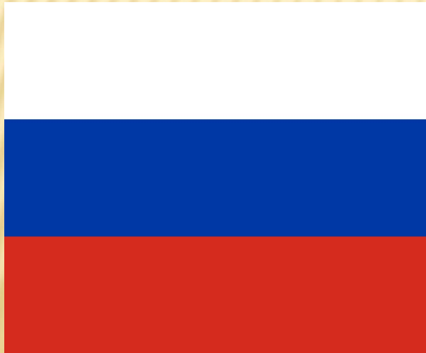
Сучасний прапор Росії: затверджений 11 грудня 1993 року.