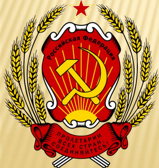
Герб Російської Федерації : 1992 -1993 роки