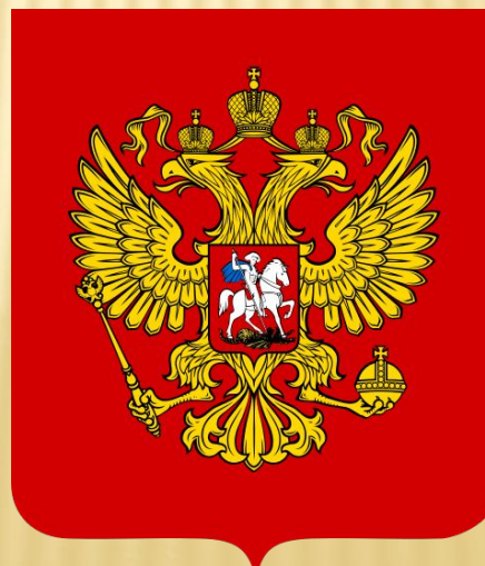
Сучасний Герб РФ затверджений 30 листопада 1993 року