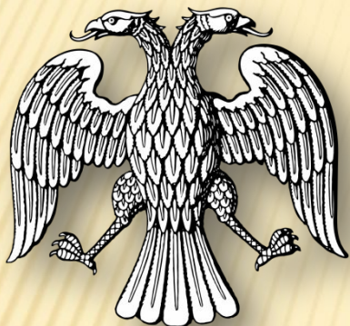
Гербовий орел на печаті Тимчасового правління 1917 р.