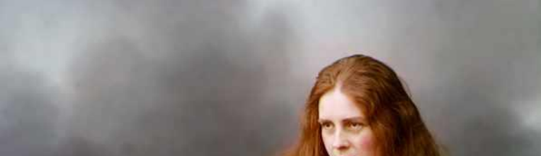
preview of 1024x819 - click to enlarge; posted on ANUB.RU