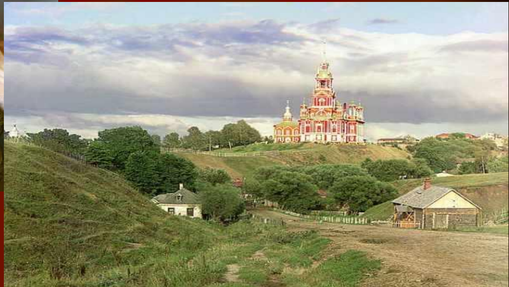
preview of 640x548 - click to enlarge; posted on ANUB.RU